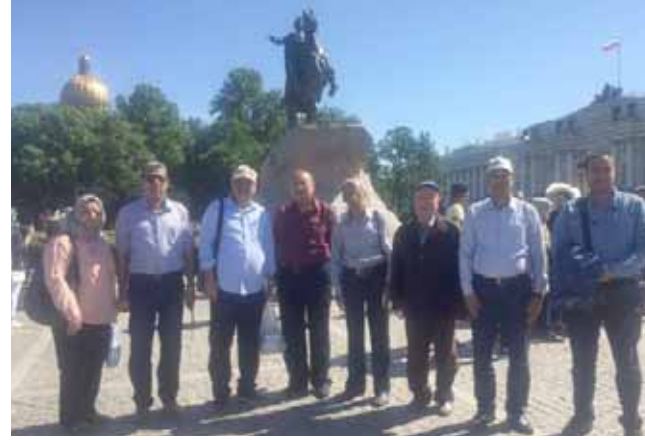
المجموعة السياحية العراقية امام تمثال الامبراطور بطرس

بالفخامة والاسراف والرقى، ويزداد منظر القصر جمالا بالنافورت المحذوقة بالماء لامتار عالية مع التماثيل الذهبية ؛