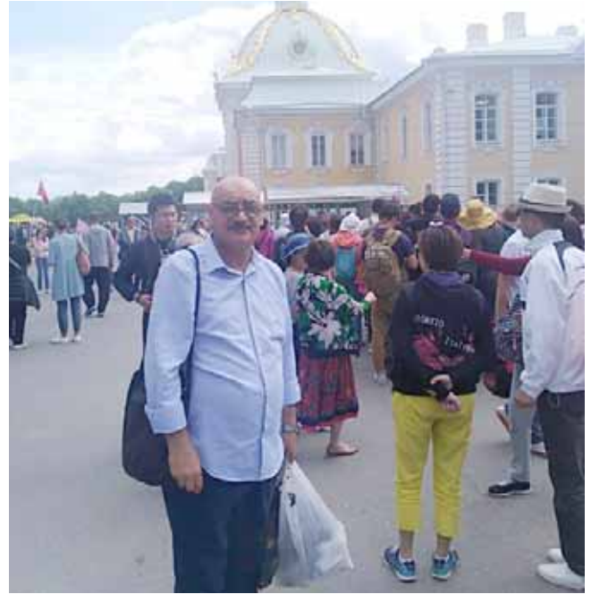
في احدى ساحات سانت بطرسبرغ (مدينة بيرووف)

هل انت مجنون لكي تعتقد بانك تستطيع اسقاط القيصر العظيم؟ كان يجيبه لينين :- انا من سوف يسقط القيصر! بهذه الثقة العالية والنظرة الشافية كان لينين يزرع الاصل في نفوس العمال والفلاحين، على الرغم من ان أجهزة بطرسبرغ (فرساوي الروسي) وهي من مواقع التراث العالمي وحينما تم بناء مول شاهق الارتفاع جذرت اليونسكو القيادة الروس الذين يحلمون ويعملون، تماما مثل القيصر اعظم (بطرس الاول) قصر روسيا الخماس 1725-1682 وهو من افضل القياصرة من عائلة (رومانوف) وهو ابو التحديث بالحياة الروسية والذي عمل على