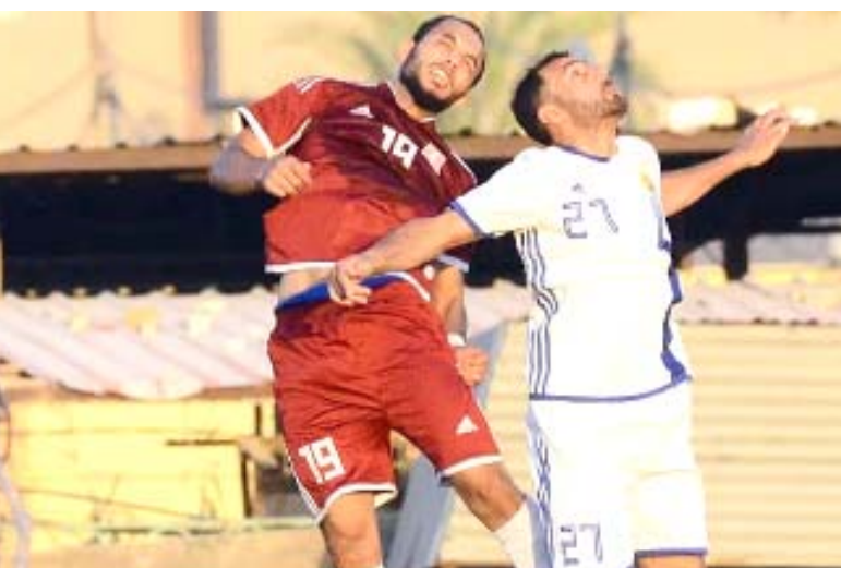
البحري يفقد على الديوانية احتفالاته بقاءء في الدوري