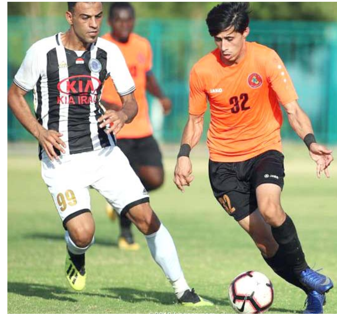
لقاء : تسعى الفرق الأخيرة الى السباق من أجل البقاء في منافسات الكبار

للقاء : تسعى الفرق الأخيرة الى السباق من أجل البقاء في منافسات الكبار