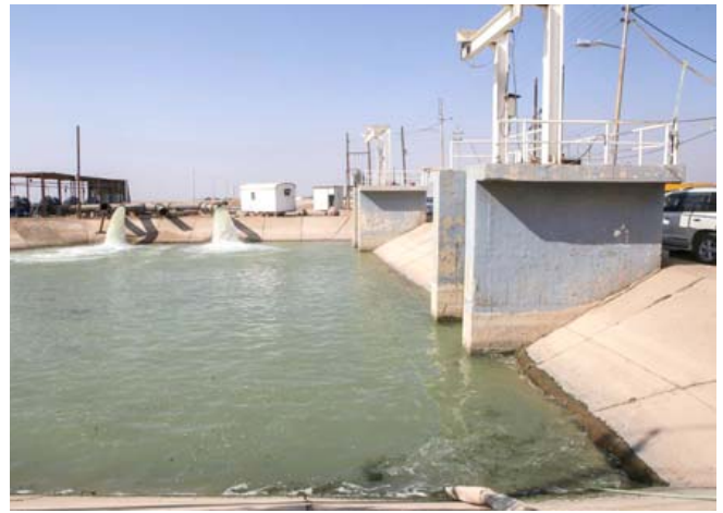
محطة : جانب من محطة تصفية مياه البراضعية في البصرة

طرق رئيسية في المحافظة. وقال المياحي في بيان اسن (قدمنا خطة خمسية اخرى وقد صوت عليها مجلس المحافظة وتم فيها التركيز بشكل كبير لتطوير الطرق وهي استجابة لمخاشدات الاهالي وشكواهم المتكررة من واقع الطرق. حيث خصصنا اكثر من 25 مليارا لإنشاء طرق رئيسية وسانونية وصيانة في الطرق العامة والريفية عن طريق دائرة الطرق والجسور فضلا عن تاسيس جهد متكامل لدائرة الطرق يشمل معمل اسفلت متطور والبيات تخصصية وموازنة تشغيلية).