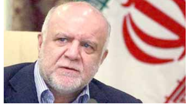
بيجان نمدار زنفقة

فبيننا (ا ف ب) - ندد وزير النفط الإيراني بيجان نمدار زنفقة أمس الإثنين في فيينا بالطابع الإحادي الجانب للاتفاق بين روسيا والسعودية على تمديد خفض الإنتاج النفطي والذي أعلن قبل اجتماع أوبك. مع التعبير عن دعمه لتمديد خفض الإنتاج الساري حالياً، اعتبر زنفقة أن منظمة الدول المصدرة للنفط والتي لا تختفي إليها روسيا، ليست منظمة تتلقى قراراً أعد خارج أوبك. وأعلن الرئيس الروسي فلاديمير