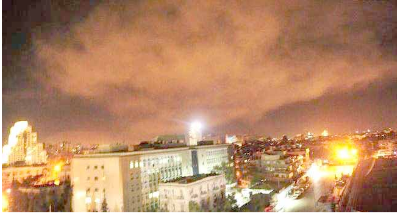
مضادات؛ سماء دمشق وتظهر فيها انوار المضادات للصواريخ الاسرائيلية

وقد كشف النقاب عن جزء من طريق قديمة تحت الأرض، تقول مؤسسة 'مدينة داوود' إنها كانت طريقاً للحج إلى المعبد اليهودي الثاني في القدس قبل نحو 2000 عام، ويتهم الفلسطينيون إسرائيل بالسعي لطردهم من المدينة. واحتلت إسرائيل القدس الشرقية عام 1967 وأضمتها لاحقاً في خطوة لم يعترف بها المجتمع الدولي. وتعتبر إسرائيل القدس بأكملها عاصمة لها، في حين يطالب الفلسطينيون بأن تكون عاصمة لدولتهم المستقبلية. وتعتبر إسرائيل التي وقعت معاهدة سلام مع الأردن في 1994 بإشراف المملكة الأردنية على المقدسات الإسلامية في المدينة.