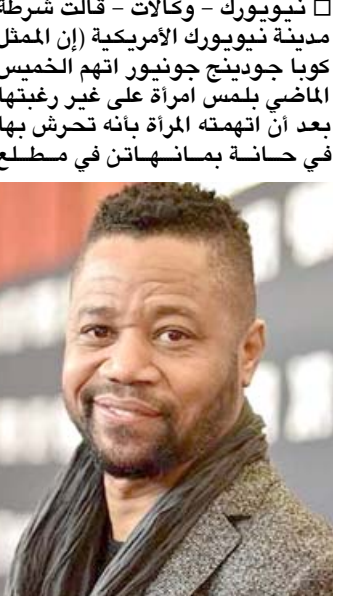
كوبا جودينج جونيو

نيويورك - وكالات - قالت شرطة مدينة نيويورك الأمريكية (إن الممثل كوبا جودينج جونيو اتهم الخميس الماضي بلمس امرأة على غير رغبتها بعد أن اتهمته المرأة بأنه تحرش بها في حانة بمانهاتن في مطلع