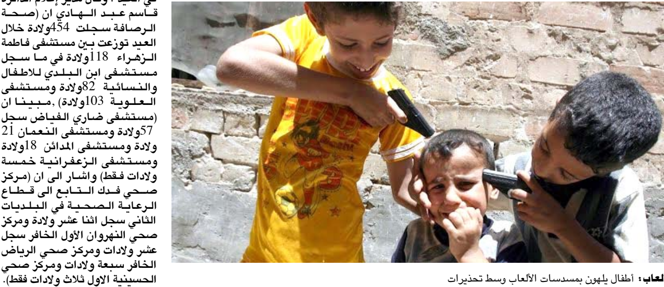
العباء: أطفال يلعبون بمسدسات الألعاب وسط تحذيرات

في مكتب مكافحة الجريمة ذهب إلى المنطقة فور تلقي البلاغ وقد وجهنا بالتحقيق في الحادث وبمعالجة تم اعتقال عدد من المشتبه بهم) وأشار إلى أن (أحد المشتبه بهم أقر بقتل بلين التي عثر على جثتها بالقرب من ملعب (دهوك).