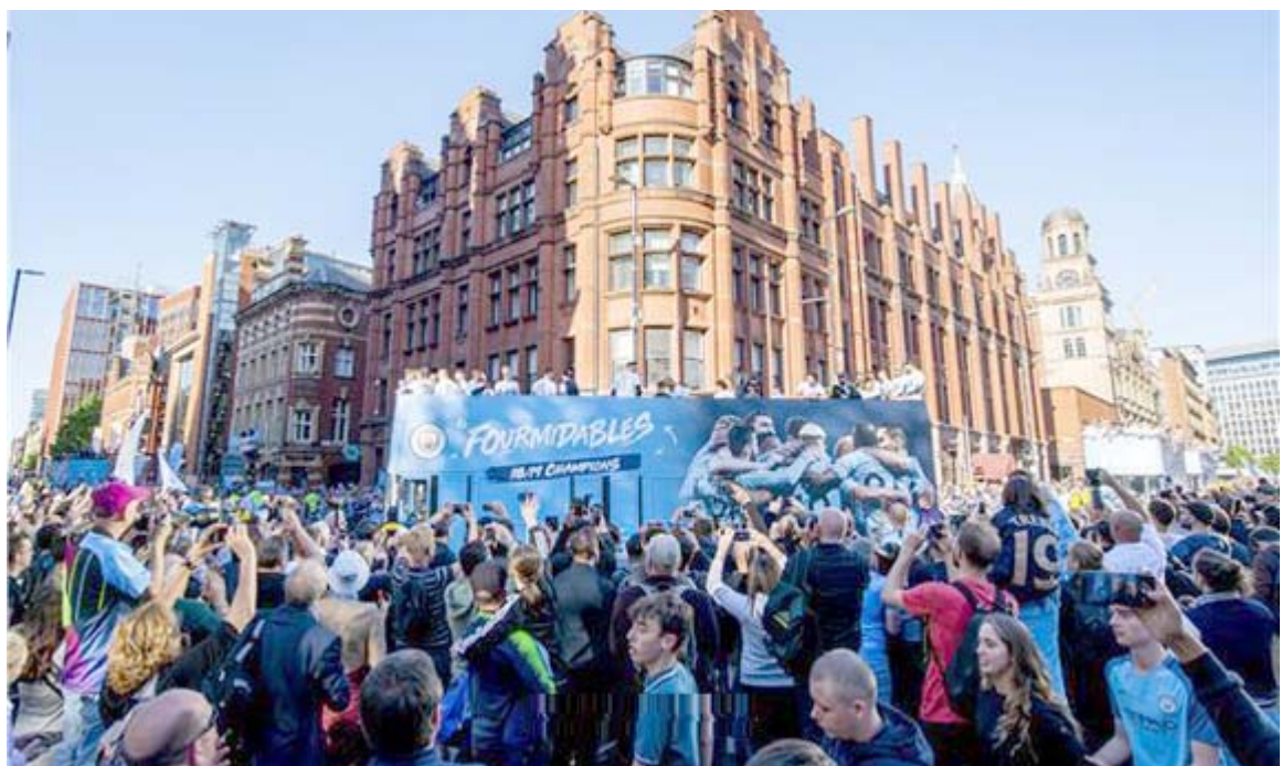
احتفال؛ فريق مانشستر سيتي يحتفل بفوزه بلقب البريميرليج

لندن - وكالات ضمن أوساسونا الصعود لدوري الدرجة الأولى الإسباني لكرة القدم، قبل 3 مباريات من نهاية دوري الدرجة الثانية بعد فوز غرناطة على السيبث (0-1). ويتصدر أوساسونا، الذي هبط من دوري الأضواء في 2017 دوري الدرجة الثانية برصيد 78 نقطة من 39 مباراة وضمن إنهاء الموسم في المركزين الأول والثاني بعد خسارة السيبث صاحب المركز الثالث على الترتيب، أرسنه ليتا