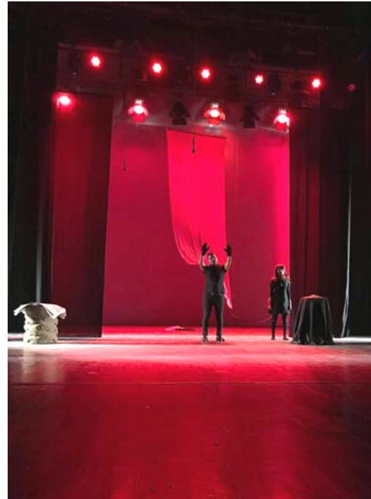
مسرح الطلبة: المصق الترويجي مسرحية (ليدي ماكبث)