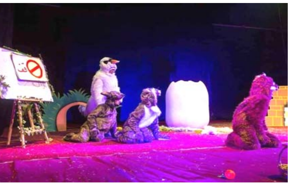
مشهد من مسرحية (لا تقل كاكاو)