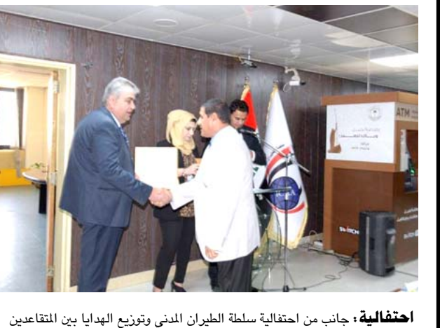
احتفالية، جانب من احتفالية سلطة الطيران المدني وتوزيع الهدايا بين المتقاعدين

بغداد - الزمان تعزز الشركة العامة للاتصالات والمعلوماتية بوزارة الإتصالات إستحداث نظام بيانات مركزي جديد بمقر الشركة يتضمن قاعدة بيانات متكاملة تتضمن الشركة اتصالات الرصافة خطوة اولى ثم يربط تدريجياً بمقر الوزارة ومن ثم المديرية).