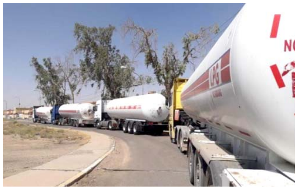
وقود : صهاريج وزارة النفط تنقل الوقود الى الجهات المشمولة بالتجهيز

واضح ياسين عن تلك الكميات في بيان امس (جبهتنا اكثر من أربعة ملايين لتر من زيت الغاز و 288 ألف لتر من البنزين لادارة امانة بغداد لأغراض والمعدات والمولدات العائدة للأمانة خلال شهر آذار الماضي). وأضاف (قمنا أيضاً بإصدار امر