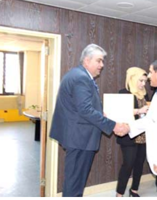
احتفالية، جانب من احتفالية سلطة الطيران المدني وتوزيع الهدايا بين المتقاعدين

مستودعات وشبكات محلية). مضيفاً (اما المستودعات والشبكات الرئيسية كالانابيب الناقلة او انابيب التصدير فانها ستكون بيد الدولة)، وأشار الى ان (بعض الدول اتجهت نحو استثمار منظومات التوزيع والغاز ومنها لقطاعات الخاص، بل عمدت للاحتفاظ بمحطة تعبئة واحدة في المحافظة كي تكون لها المرونة بالتدخل في حالة الأزمات). وأضاف ان (العراق لديه في قطاع توزيع المنتجات النفطية خليط من محطات التعبئة، فهناك عدد كبير من المحطات مملوكة وتدار من القطاع الخاص يبلغ عددها 1400 محطة ولديه محطات كبيرة تدار من القطاع الحكومي، وعليه فالوزارة ليست لديها خطة محددة الى الآن للتعامل مع هذا الموضوع لكن لديها دراسة مشروع لكيفية اطلاق قطاع التوزيع الخاص لتتضمن من خلال اشراك القطاع الخاص لتطوير عمل توزيع المشتقات). وتابع ان (الوزارة شرعت بدراسة البناات الصناعية التي من الممكن ان يشيدها القطاع الخاص بالاستثمار على المنتجات