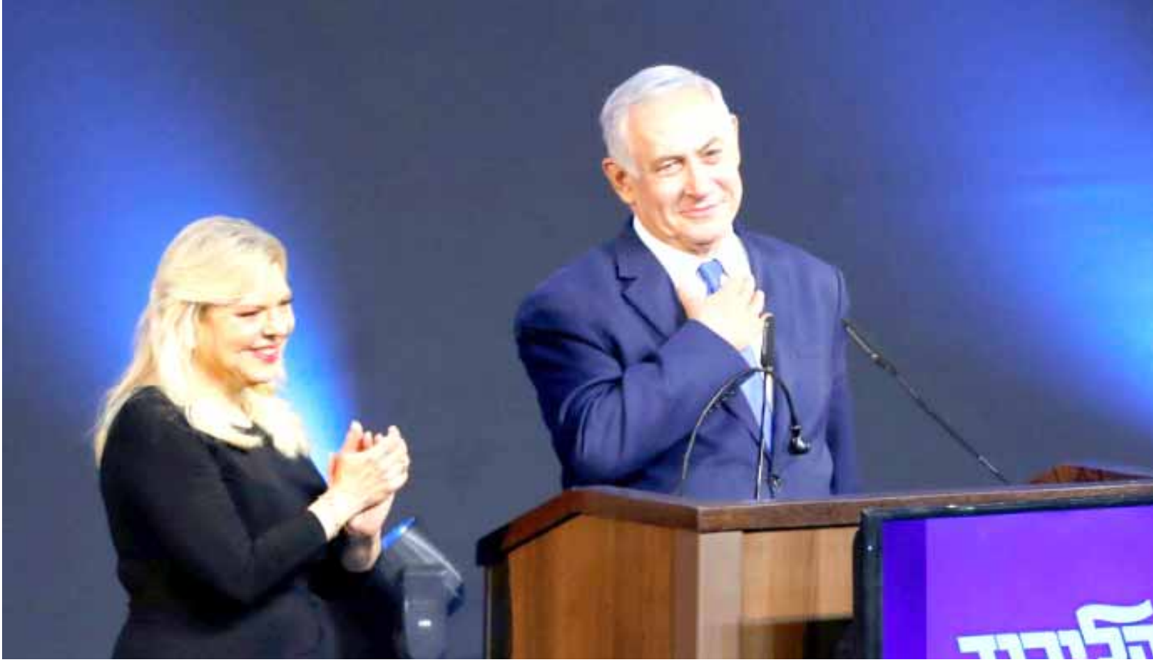
انتخابات : بنيامين نتانياهو وزوجته في الحملة الانتخابية الاسرائيلية

واشنطن) ، (أ ف ب) - رفض وزير الخارجية الأميركي مايك بومبيو القول ما إذا كانت الولايات المتحدة ستعارض ضمًا محتملاً من جانب إسرائيل لمستوطنات الضفة الغربية، كما رفض أن يؤكد دعم واشنطن لإنشاء دولة فلسطينية. وفي جلسة استماع أمام لجنة فرعية في مجلس الشيوخ، رفض بومبيو الإجابة على سؤال السناتور الديمقراطي كريس فان هولين عما إذا كانت إدارة دونالد ترامب ستعارض ضم إسرائيل بشكل أحادي لكل الضفة الغربية أو لجزء منها. وكان رئيس الوزراء الإسرائيلي بنيامين نتانياهو أعلن قبل ساعات من فوزه في الانتخابات، وقال الإسرائيليون نتانياهو الذي يثير إعجاب البعض ويكرهه آخرون، يمكنه مواصلة حكمه الطويل إن ساءت التغيير وقت مع غانتس الحديث العهد على الساحة السياسية.