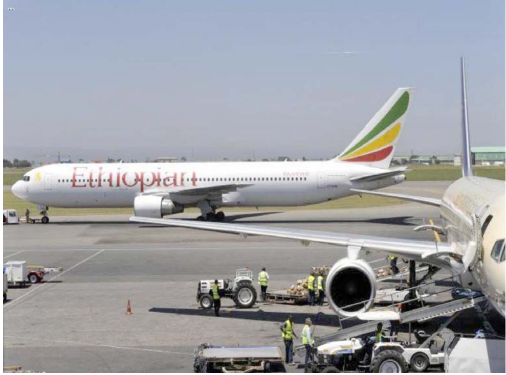
تحطم: فريق الإنقاذ قرب الطائرة المنكوبة قبل اقلاعها في مطار اديس ابابا

التعزيزات ويقوم بقصف مواقع للمتطرفين البوذيين بالمدفعية الثقيلة. وتحظر السلطات الدخول إلى شمال ولاية راخين باستثناء زيارات تنظمها الحكومة. ومن الصعب الحصول على معلومات للتأكد من الأنباء بشكل مستقل.