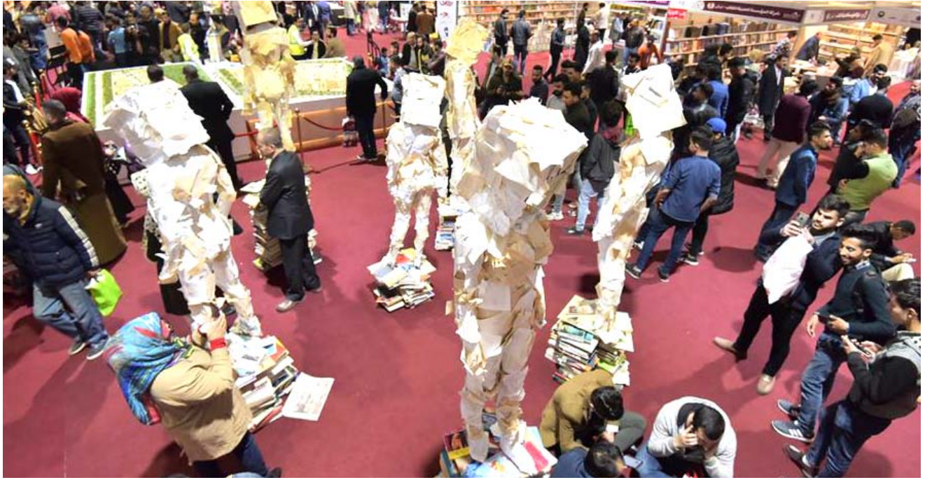
جانب من معرض بغداد للكتاب