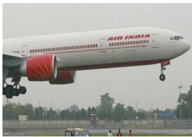
الطيران الهندي في اجواء النجف

بسبب سوء الأحوال الجوية التي تعرضت لها المحافظة، وقد وجه مدير الفرع أيضا بتوفير المواد الحاكمة للشبكة الكهربائية في محولات وعمدة اسلاك وقابلات من خلال السطب من مسؤول قسم المخازن الشاع إلى الفرع تسهيل كافة إجراءات خروج هذه المواد والعمل