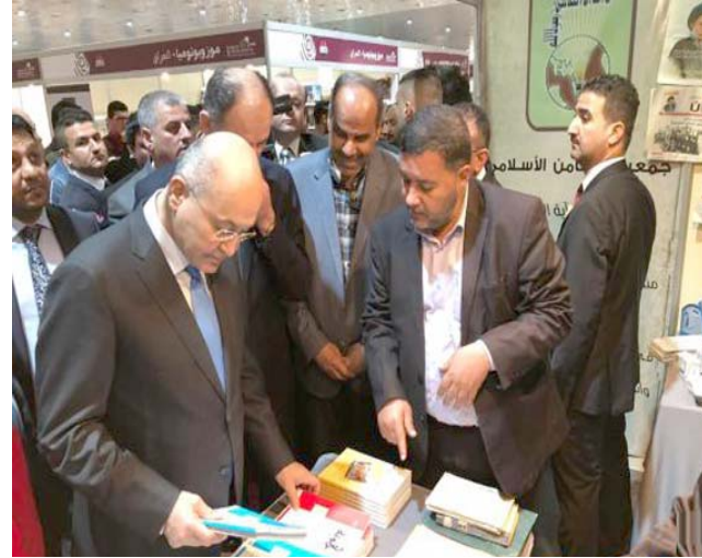
جانب من أجنحة معرض بغداد الدولي للكتاب