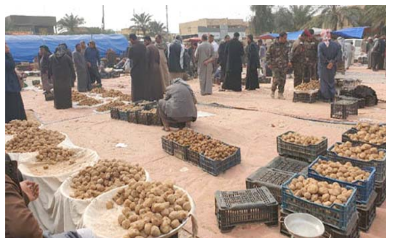
الكما يغزو اسواق المتنى والمحافظات