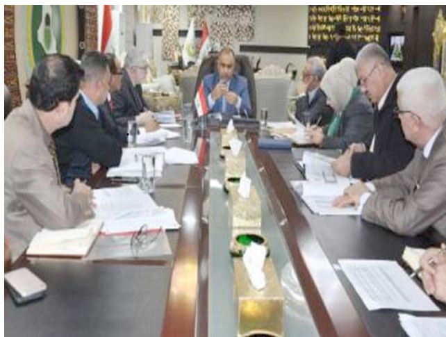
وزير الزراعة مقرساً اجتماعاً

النجف - سعدون الجابري سوق محافظة المتنى نحو خمسة اطنان من نبات الكما الى السوق المحلية منذ افتتاح مركز البيع الى منتصف الشهر الماضي.وقال مصدر ان (المتنى تسوق اكثر من 15ألف طن من نبات الكما والمعروفة باسم فاكهة الصحراء منذ افتتاح مركز البيع الى منتصف شهر كانون الثاني الماضي). وشهدت الأسواق العراقية انتعاشاً نسبياً بعد الركود الاقتصادي الذي سجلته في الأشهر الماضية بسبب الوضع السياسي والأمني المتذبذب في البلاد، وتعد صحراء الأنبار والسماوة والنجف وواسط والبصرة والموصل وصلاح الدين أبرز المناطق التي يكثر فيها الكما بعد موسم الأنبار والعواصف الربدية، ويبدأ موسم الكما أو