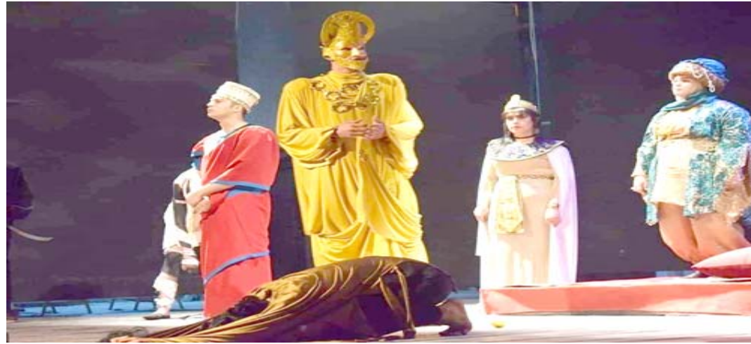
عمل جديد؛ مشهد من مسرحية (وحمة آدم)