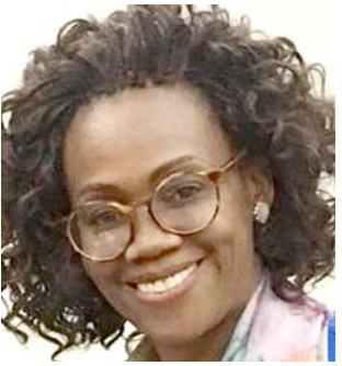
اييسي كاميل بار

وكشف رئيس القمة العالمية للحكومات ان البابا فرانسيس بابا الكهنيسة الكاثوليكية سيخطب الحكومات في بث مباشر، ما يؤكد الريادة العالمية التي حققها القمة، وموقعها كمنصة جامعة للمعتين بالتنمية وتطوير عمل الحكومات. قادة دول ورؤساء حكومات وحسب المؤتمر من المعلومات فإن القمة استقطبت أبرز الشخصيات العالمية صاحبة التجارب الناجحة في مختلف القطاعات الحيوية، حيث ستتضيف في جلسات حوارية خاصة توجهات القمة الهادفة لدعم جهود الحكومات في صناعة مستقبل أفضل لـ 7مليارات إنسان. واعلن رئيس القمة ان القمة ستشهد