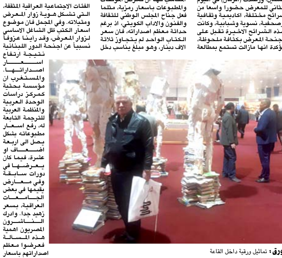
ورق : تماثيل ورقية داخل القاعة

مقفولة او مقبولة، ولاسيما كتب الاطفال، وهذه الأخيرة كانت زهيدة جدا بسبب ان بعضها عرض ضمن اجنحة غنائية او واجهية بينما دور لاهوتية، قدمت اصدارات لمؤنة وانيقة او مصورة تستدرج الأطفال نحو الفراء والاستيعاب، وكان حضور العوائل برفقة ابنائهم الصغار اشارة واضحة الى انتقال هواية المطالعة الى الاجيال الجديدة. وتبدو التحضيرات هذا العام موفقة جدا، برغم ضعف الدعم الحكومي لادارة المعرض التي كان لولمها البارز الراضي، ولولا مبادرة البنك المركزي العراقي بالتنسيق مع رابطة المصرف الأهلية لتعزز على المعرض تسجيل الاجابيات التي رانها في هذه الدورة، لكن المآخذ ان هذا الدعم فرض هيمنة غريبة على برنامج المعرض وفعالياته، إذ احتل القطاع المصرفي نسبة كبيرة من فقراته الثقافية اليومية، التي تمدت من الساعة 12ظهرا الى السادسة مساء، وهو ما افقد الفعاليات حيويتها المطلوبة اراء جمهور، متنوع الاهتمامات وينحو الى العلوم الاجتماعية والابداعية وحتى الترفيهية المنضبطة. ضغط الرعاة وكان على ادارة المعرض الانتباه الى هذا الامر وتجنس الوقوع تحت ضغط الرعاة او المولين، وقمة نقطة اصداراتهم باسعار