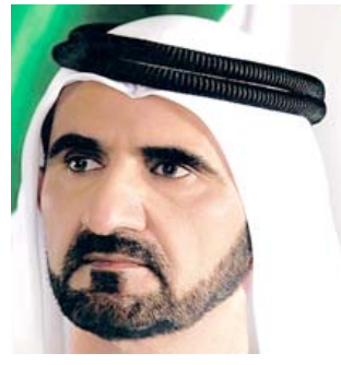
محمد بن راشد