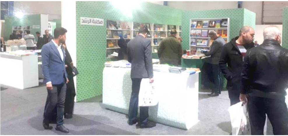
معرض : جانب من اجنحة معرض بغداد الدولي للكتاب