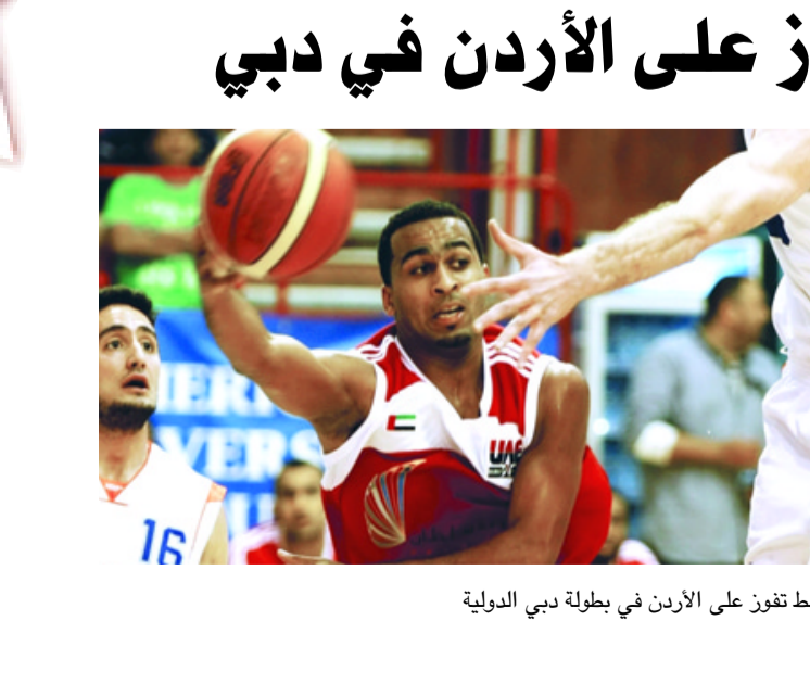
سلة النفط تفوز على الأردن في بطولة دبي الدولية لكرة السلة

العراقي هم قطر واحد ولم يعرضني والذي على اي مدرب للمنتخب العراقي وانا اخترت اللعب لقطر. على صعيد متصل رفضت لجنة الانضباط في المنتخب الاسيوي لكرة القدم، احتجاج الامارات الذي شكك في قانونية جنين ثنائي المنتخب القطري المعز على الملود في قطر بالبطولة عقب فوزه بهدف اليبان بثلاثة اهداف لهدف المنتخب العراقي عن احتفاله بالهدف وبعض الاعلاميين كبروا الموضوع وكان الودع يلعب في قطر. وأضاف: اهدى فوزي بالهدف للشعب