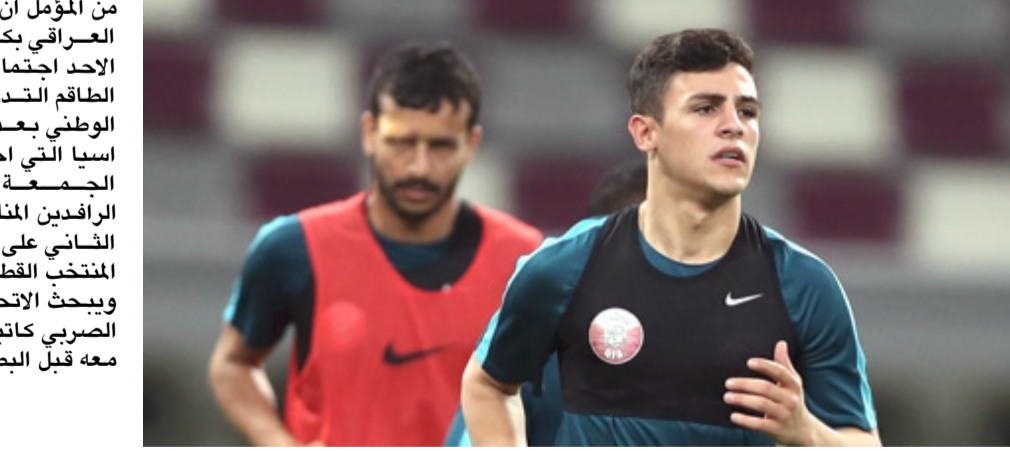
المدرب الصربي كاتيتش

العراقي هم قطر واحد ولم يعرضني والذي على اي مدرب للمنتخب العراقي وانا اخترت اللعب لقطر. على صعيد متصل رفضت لجنة الانضباط في المنتخب الاسيوي لكرة القدم، احتجاج الامارات الذي شكك في قانونية جنين ثنائي المنتخب القطري المعز على الملود في قطر بالبطولة عقب فوزه بهدف اليبان بثلاثة اهداف لهدف المنتخب العراقي عن احتفاله بالهدف وبعض الاعلاميين كبروا الموضوع وكان الودع يلعب في قطر. وأضاف: اهدى فوزي بالهدف للشعب