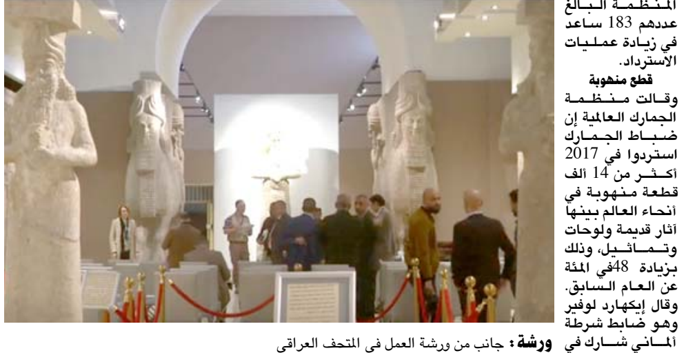
ورشة عمل في المتحف العراقي

الجمارك في أنحاء العالم بشأن عمليات الضبط المتعلقة بالتهرات العمالي (ليسست سوى قحة جبل الجليلي) وإن تحسين التنسيق بين السبلول أعضاء المنظمة البالغ عددهم 183 ساعد في زيادة عمليات الاسترداد.