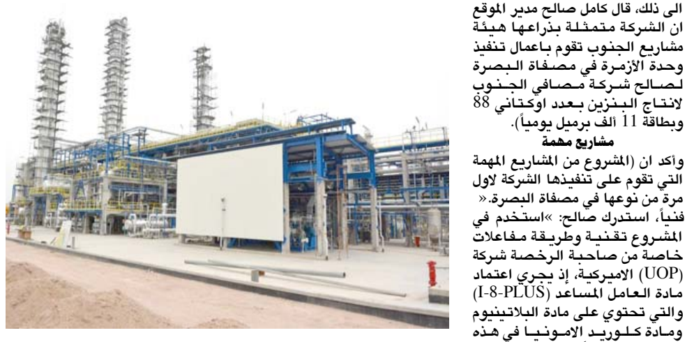
مشروع مصافي الجنوب

مشروع وإضافة المؤمل تشغيل الوحدة في اقل من ستة اشهر). وواضح وحيد ان (المشروع الذي هو وحدة معقدة يجمع بين تقنيات معالجة البنزين والبنزين عالي النقاوة في مصفاة البصرة لصالح شركة مصافي الجنوب لانجاز البنزين بعدد اوتكتاني 88 وبقاية 11 الف برميل يوميا).