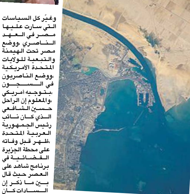
خريطة قناة السويس

أوربا ،ويعد توحدها على يد المستشار بيسمارك عام 1870 استطاعت ان تبني حضارة فائقة ،والطور تحبتر ألمانيا اقوى قوة اقتصادية في العالم بعد الولايات المتحدة والصين واليابان . كما ان المشروع الوحدوي الذي تبناه عبد الناصر يهدف إلى بناء قوة عسكرية فائقة تساهم في تحرير الاراضي المغتصبة في فلسطين وغيرها من الاراضي العربية المحتلة، حيث لا يمكن لأي دولة عربية بمفردها ان تحرر فلسطين من الاغتصاب الصهيوني حيث ساهمت بريطانيا في الدرجة الأولى في تسليم فلسطين لليهود الصهاينة عندما كانت فلسطين تحت