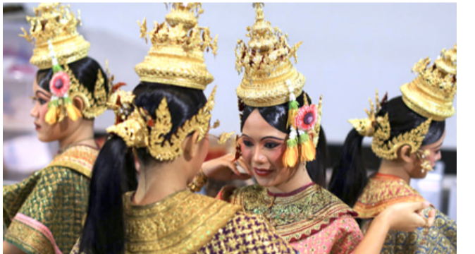
فتيات يؤدين رقصة الاقنعة التقليدية