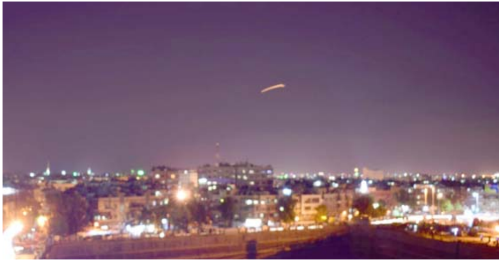
اهداف: دفاعات جوية سورية تصدى لأهداف معادية فوق دمشق

بيروت، (ا ف ب) أطلقت إسرائيل مساء امس صواريخ على مواقع بالقرب من دمشق،حسبما ذكرت وسائل الإعلام السورية الرسمية بينما قال الجيش الإسرائيلي انه تصدى لصاروخ مضاد لطيران اطلق من سوريا. وذكرت وكالة الأنباء السورية الرسمية (سانا) نقلا عن مصدر عسكري ان الدفاعات الجوية تصدت لصواريخ معادية اطلقتها الطيران الحربي الإسرائيلي من فوق الأراضي اللبنانية.