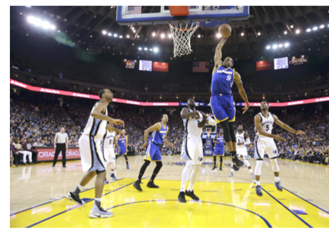
جانب من منافسات سلّة المحترفين

المقبل في تشارلوت، ويحسب الرابطة، يستمر التصويت المفتوح أمام الجمهور عبر شبكة الانترنت، حتى 21 كانون الثاني المقبل. وكانت المباراة السنوية تجمع بين فريقين يمثلان المنطقتين الشرقية والغربية، ويضم كل منهما أفضل اللاعبين من فرق المنطقة التي ينتم لها. إلا أن رابطة الدوري اعتمدت منذ 2018، إقامة المباراة بين فريقين من أفضل نجوم اللعبة بغض النظر عن انتمائهم إلى هذه المنطقة أو تلك. ويقوم اللاعبان (واحد من الشرقية وآخر من الغربية) اللذان يحصلان على العدد الأكبر من الأصوات، بتشكل الفريقين. وستلعب أسماء لاعبي الفريقين واللاعبين الأساسيين في 24 كانون الثاني، في حين ستلعب في 31 منه أسماء الاحتياطيين اللذين يختارهم مدربي الفريقين. وستكون حصة