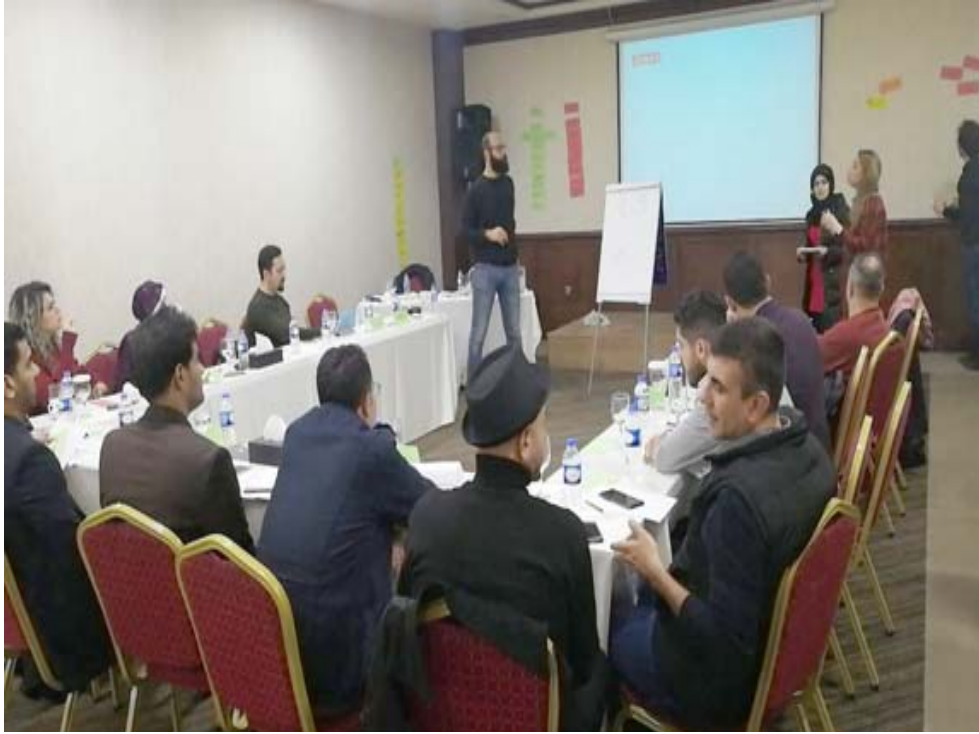
محاضرة، جانب من محاضرة عن الصحافة الاحترافية

الجيش الإلكتروني-فضلا عن تحديث بيئة العمل المعقدة والخسطنرة- الموصل و التحديات القانونية في حق الحصول على المعلومات والعقوبات). ما تتضمن الجلسات الأخرى مناقشة واقع الاقليات والتحارب الميدانية والتوصيات لتطوير العمل الصحفي بالإضافة الى إنتاج المواد الصحفية في الجامعات المؤثرة في الرأي العام.