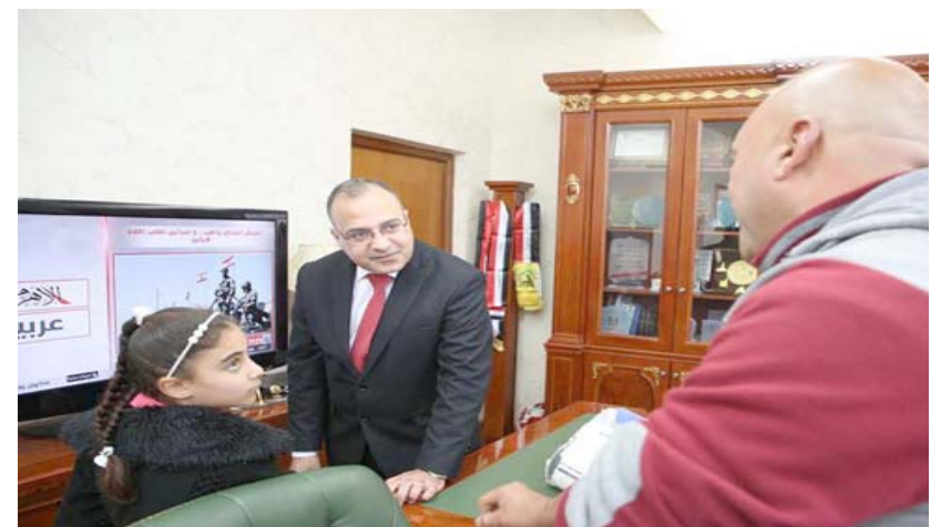
زيارة: مسؤول في صحة الرصافة خلال زيارة ميدانية