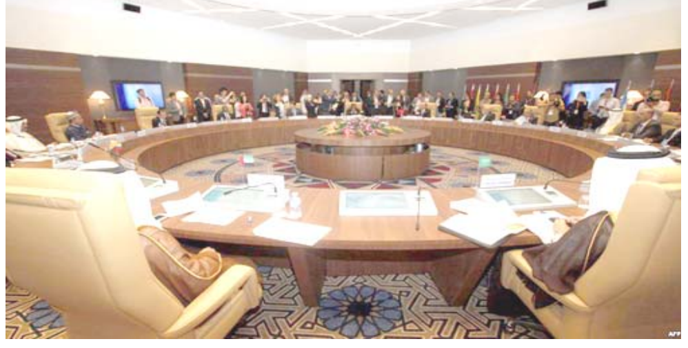
جلسة : اعضاء منظمة اوبك خلال احد اجتماعاتهم

وقالت اوك في بيان امس ان (السالة القطرية الموجهة من وزير الدولة لشؤون الطاقة سعد الكعبي عبرت عن خالص تقديرها للبلدان الاعضاء وانه لكل دولة عضو في المنظمة الحق بالسياس في الانسحاب منها دون الحاجة الى قرار من المنظم) ولفت الى ان (المنظمة تحترم القرار الذي اتخذته قطر وتعرب عن شكرها ودعم المنظمة لعقود عديدة). وقررت قطر الانسحاب من المنظمة