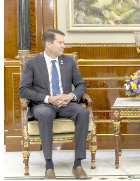
لقاء : رئيس إقليم كردستان يلتقي عضو الكونغرس الأمريكي

إلى (ضرورة تصدير النفط الإقليم، وناقضاً الاستعدادات لإجراء الإنتخابات التشريعية في الإقليم، وكذلك الإنتخابات الرئاسية الأمريكية، والوضع المتنازم والحروب والتصعيد في الشرق الأوسط والجهود المبذولة لتحقيق الأمن والاستقرار في المنطقة عامة)، على صعيد متصل، استقبل رئيس الوزراء محمد شياع السوداني، رئيس مجلس المفوضين في المفوضية العليا المستقلة للانتخابات عمر أحمد محمد، وأعضاء مجلسها، وقال بيان تلقته (الزمن) أمس إن (اللقاء شهد مناقشة الاستعدادات الجارية للمفوضية وتحضيراتها لإقامة إنتخابات برلمان الإقليم في 20 تشرين الأول الجاري، واستكمال جميع الإجراءات الديمقراطية المهمة، وجدد السوداني (دعم الحكومة لجهود مفوضية الانتخابات، وتأمين كل متطلبات العملية الانتخابية)، مؤكداً (ضرورة أن تبذل المفوضية والعاملون فيها أقصى الجهود مع العذ التنازلي لإقامة الإنتخابات، واعتماد الحيادية والشفافية وتحقيق العدالة الانتخابية بما يضمن الحفاظ على أصوات الناخبين.