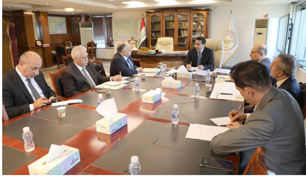
اجتماع: وزير النقل يرأس اجتماعاً يناقش تطوير الخدمات

الإعلان عن خطوط جديدة في بغداد والمحافظات، حسب توجيهات رئيس الوزراء، محمد شياع السوداني، وأوضح السعدوي ان الخطوط الجديدة تاتي لتقديم الخدمة لطلبة جامعية البين، لكونها تقع في طريق شارع مطار بغداد الدولي، وهي بعيدة عن النقل الحكومي الخاص، وتحضن 10 الاف طالب، حسب مذكر، وتابع ان (الوزارة مستمرة بافتتاح المزيد من خطوط النقل الجماعي في العاصمة لتسهيل عملية التنقل والحد من الاختناقات المرورية).