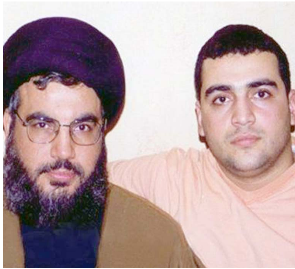
جواد نصر الله مع ابيه حسن نصر الله

حليفاً مقرباً لإيران ويعد الرئيس السوري بشار الأسد ويهدد إسرائيل. ولكنه يعتبر في لبنان واحداً من ثلاثة أحزاب سياسية قوية. والثلاثة اتهم رئيس الحكومة المكلف سعد الحريري حزب الله بعرقلة تشكيل الحكومة في لبنان، بسبب مساعيه للحصول على تمثيل أقوى له ولحلفائه في الحكومة. وقال الحريري في مؤتمر صحافي عقده في دارته في وسط بيروت "من المؤسف جداً أن يضع حزب الله نفسه في موقع المسؤولية عن عرقلة تشكيل الحكومة". إلا أن واشنطن لا تعتبر حزب الله لاعباً سياسياً بل واجهة لعوتها إيران. وصرح سيجال ماندلكر، وكيل وزارة الخزانة لشؤون الإرهاب واستخبارات التمويل "حزب الله هو وكيل إرهابي للنظام الإيراني ويسعى إلى تقويض سيادة العراق وزعزعة استقرار الشرق الأوسط". وأضاف أن "جهود وزارة الخزانة تهدف إلى عرقلة محاولات حزب الله لاستغلال العراق لتبييض الأموال وشراء الأسلحة وتدريب المقاتلين وجمع المعلومات بوصفه وكيلاً لإيران". بدوره قال السفير الأميركي العراقيين إلى سوريا بتكليف من الإرهاب نايفان سيليز للصحافيين إن "أفعال حزب الله المدمرة عرّضت الشعب اللبناني للخطر". وأنهم الدبلوماسية اللبنانية حزب الله، الفصل اللبناني الذي احتفظ بسلاحه بعد نهاية الحرب الأهلية اللبنانية (1975-1990) خلفاً للحزب، العظمى من اطراف تلك الحرب، بأنه "يستخدم بفعالية المدنيين