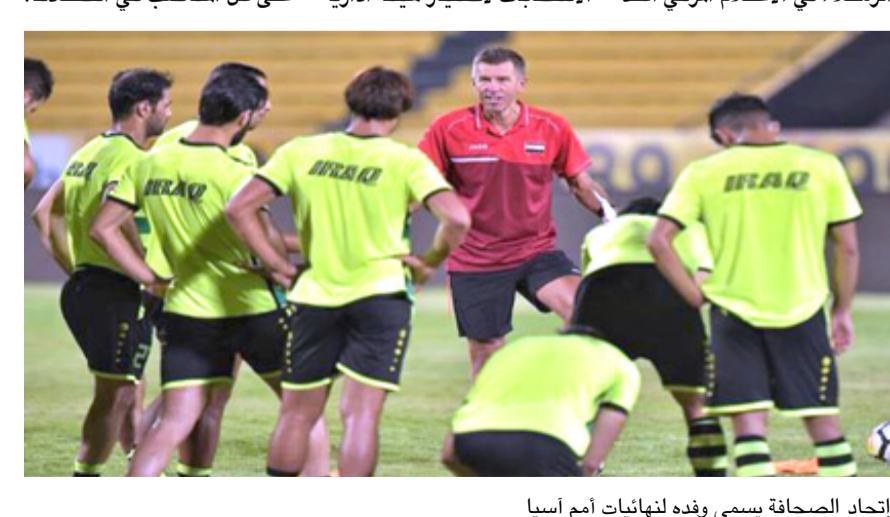
إتحاد الصحافة ويسمي وفده لنهائيات أمم آسيا