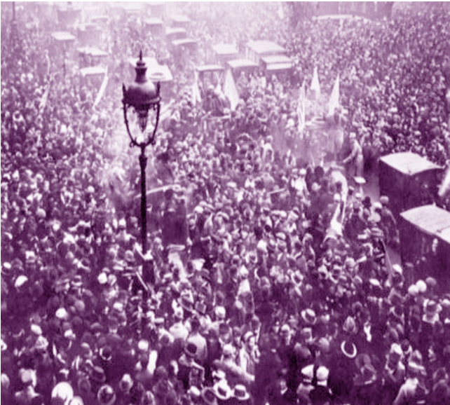
احتفالات نهاية الحرب العالمية الأولى

وخلفا لذلك، كانت الحرب ونتاجها بنواجه في فرنسا وبريطانيا تيارا سلميا من شأنه أن يفسر شلل الديمقراطية الأوروبية بمواجهة هتلر. وبعيدا عن ألمانيا، اعادت معاهدات السلام رسم خريطة أوروبا والشرق الأوسط بالكامل عبر