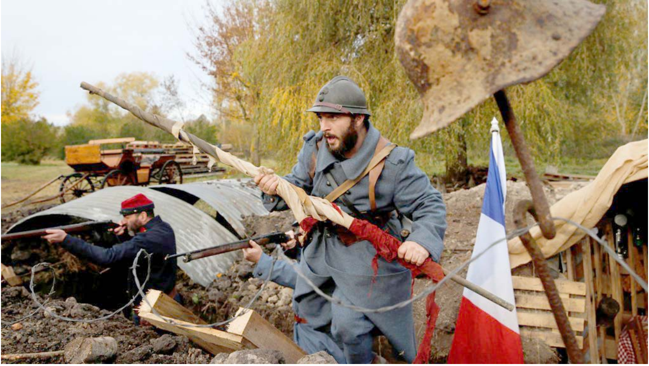
حرب؛ جنود في خنادق القتال خلال الحرب العالمية الأولى

الاول/اكتوبر، ابرق المستشار الألماني الامير ماکس فون بادن،