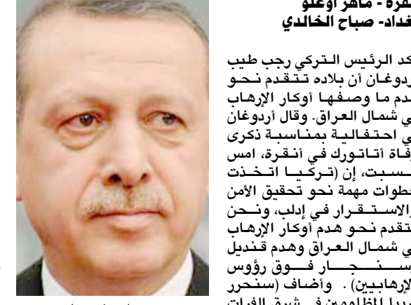
انقرة - ماهر اوغلو بغداد- صباح الخالدي

صباح الاحمد الصباح، بحسب بيان رئاسي اوضح ان الزيارة تتضمن مناقشة ملفات عديدة ابرزها بحث العلاقات الثنائية وسبل تطويرها بين البلدين. وازدادت العلاقات مع عمقه العربي والخليجي، والتعاون مع اشقائه في ارساء قواعد حسن الجوار والتكامل الاقتصادي والانصافي والنهوض الثقافي المشترك بما يخدم شعوب المنطقة ويعزز مفاهيم التعاون الدولي).