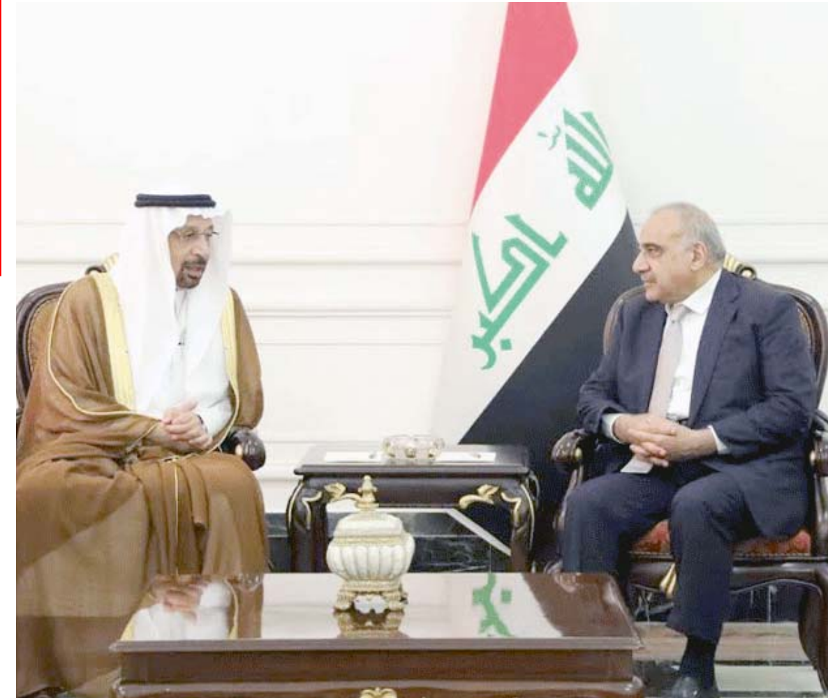
استقبال: رئيس الوزراء عادل عبد المهدي خلال استقباله في بغداد امس وزير الطاقة السعودي

وقال المقدم احمد صديق من قيادة سفين في قوات البشمركة في تصريح امس ان (مخالفتي من التحالف الدولي يشاروا في الساعة 8:05 من صباح امس السبت بشن قصف مكثف على جبل قرجوع لمتهداف مواقع داعش)، ممن دون الالاء بتفاصيل. وتمكنت مديرية الاستخبارات العسكرية من تحرير اربعة مختطفين في نينوى. وواضح بيان مركز الاعلام الاتني ان (رجال مديرية الاستخبارات العسكرية في الفرقة 15 تمكنوا خلال عملية استخبارية نوعية اعتمدت الذخوة في التخطيط والتوقيت من تحرير اربعة مختطفين من مخلفات عصابات متمن السرفة والاختطاف باختطافهم مع عجلاتهم التي بالمنطقة الواقعة بين ربيعة والحياضية غربي الموصل).