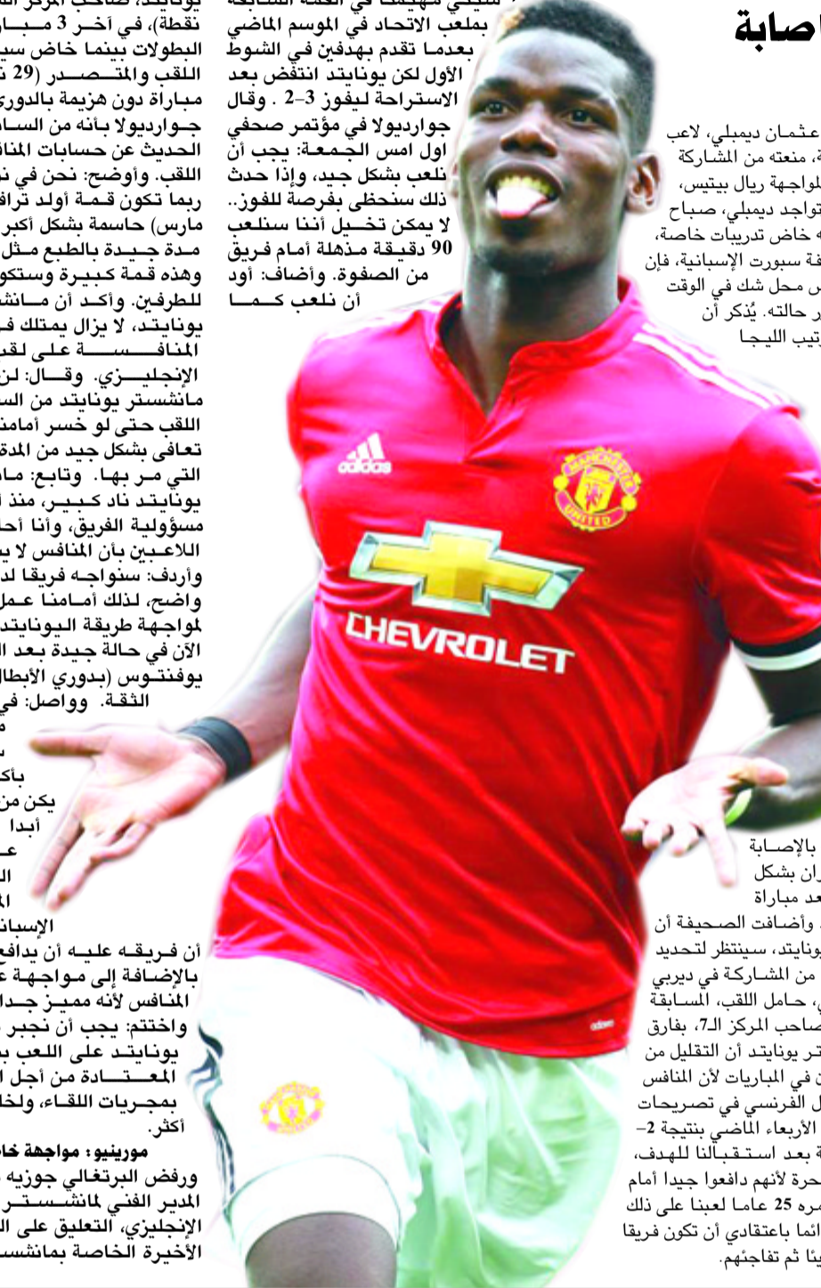
نجم مانشستر يونايتد الفرنسي بول بوغبا، يثير الشكوك حول إمكانية مشاركته في الدوري الإسباني، اليوم الأحد، على ملعب الاتحاد، بالجملة الـ12 من الدوري الإسباني، وذكرت صحيفة تيلجراف البريطانية، أن بوغبا لم يشارك في مران فريقه أول أمس الجمعة، ما أضره لخوض مراناً منفرداً في الصلابة الرياضية، بعد تعرضه لما وصفته بالإصابة السببية، وخاض الكيوس سانثيز المران بشكل طبيعي، رغم أنه كان يعاني من إصابة بعد مباراة يوفنتوس الماضية في دوري أبطال أوروبا، وأضافت الصحيفة أن

□ لندن - وكالات: أثار نجم وسط مانشستر يونايتد، الفرنسي بول بوغبا، الشكوك حول إمكانية مشاركته في الدوري الإسباني، اليوم الأحد، على ملعب الاتحاد، بالجملة الـ12 من الدوري الإسباني، وذكرت صحيفة تيلجراف البريطانية، أن بوغبا لم يشارك في مران فريقه أول أمس الجمعة، ما أضره لخوض مراناً منفرداً في الصلابة الرياضية، بعد تعرضه لما وصفته بالإصابة السببية، وخاض الكيوس سانثيز المران بشكل طبيعي، رغم أنه كان يعاني من إصابة بعد مباراة يوفنتوس الماضية في دوري أبطال أوروبا، وأضافت الصحيفة أن