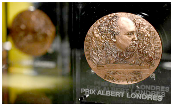
بقيّة الخبر على موقع (الزمان)

باريس (ا ف ب) - (سرفت) لجنة تحكيم جائزة البير لوندري للصحافة الفرنكوفونية النظم عن إقامة حفل توزيع مكافئاتها لسنة 2024 خلال تشرين الأول/اكتوبر الجاري في بيروت، وحددت كانون الأول/ديسمبر موعداً بديلاً لتنظيمه في باريس، على ما أعلنت الجمعية المنظمة الثلاثة. وأوضحت الجمعية التي تمنح هذه الجائزة لأفضل تقرير مكتوب وسموع ومرئي باللغة الفرنسية خلال السنة أنها كانت تؤمن أن تكون بيروت مكاناً "لإعلان الاختيار الأولي" للقصص الصحافية، لكن الأحداث الأخيرة "فعلتها" إلى تعديل "مشروعها". وأضافت في بيان: "إن تضامناً وصادقاً واحتراماً لرافيق بلداً قريباً جداً منا، وكل أولئك الذين، بفضل التزامهم الصحافي، يتبحرون لنا أن نعرف ونرى ونفهم.