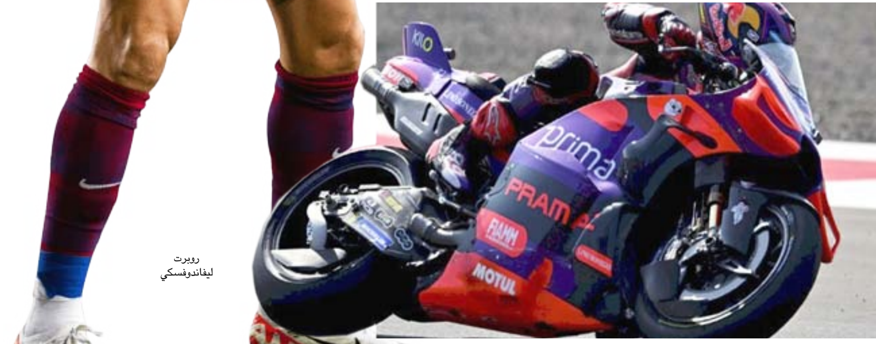
سباق : هيمين الإسباني خورخي مارتن على سباق جائزة إندونيسيا الكبرى وأحزرت المركز الأول

وصيف بطل وبلغ الإسباني كارلوس ألكاراس المصنف ثانياً عالمياً المباراة النهائية لدورة بكين الدولية في كرة المضرب 500 نقطة لفوزه على الروسي دانييل مدفيديف الخامس ووصيف بطل الموسم الماضي 5 و 6 3 الثلاثاء في نصف النهائي. ويلتقي ألكاراس، المصنف ثانياً في الدورة والبالغ من العمر 21 عاماً، في المباراة النهائية مع الإيطالي يانك سيبير الأول عالمياً