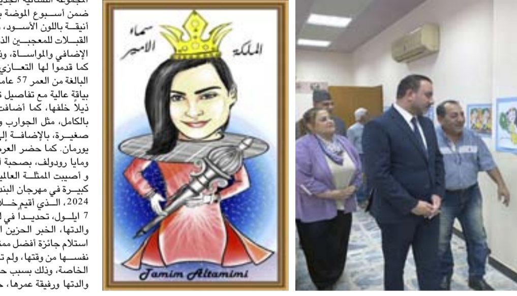
الأمير، وبعض الشخصيات الكارثونية العالمية، مشيراً إلى أن (الأعمال ونظمت اساليب فنية معاصرة مستندة إلى تقنيات رقمية).

أزياء ونتاجات بدوية جسدت فيها موهوبات الحب والتسامح والتفكير الإيجابي. من جانبها أوضح التميمي ان العرض الذي حضره جمع من المهتمين، ضم