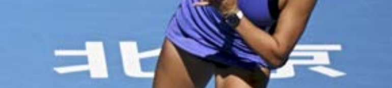
دورة : جيسيسكا بيغولا خلال مباراتها أمام الإسبانية باولا بادوسا في دورة بكين المفتوحة

دورة بكين : ألكاراس يطيح بمدفيديف ويبلغ المباراة النهائية بيغولا تودّع ثمن النهائي وتشانغ تكتب التاريخ