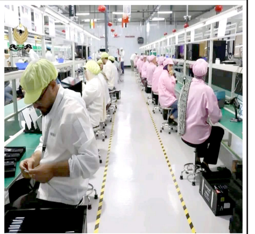
مصنع : أول معمل لصناعة الهواتف الذكية في إقليم كردستان خاصة العراق عامة و يتم تصنيع 30 ألف هاتف شهرياً ، ويتراوح سعر الهاتف الواحد من 99 إلى 120 دولار فقط . عن مجموعة واتساب

أكد الخبير الاقتصادي، حيدر عبد الله، أن تصاعد أسعار الدولار يرفع مستويات الذهب في السوق المحلية، وقال لـ (الزمان) أمس أن (الضعف السياسي