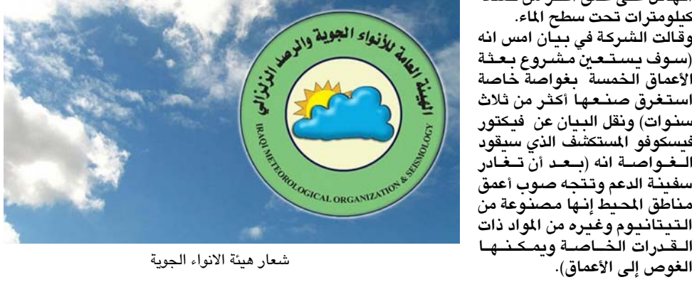
شعار هيئة الانواء الجوية

للغواصة في ولاية فلوريا الامريكية عن انه للمرة الاولى، سيكون بوسع البشر زيارة اعماق نقطة في قاع كل من المحيطات الخمسة مستخدمين غواصة تتسع لشخصين صممت بحيث تكون قادرة على مقاومة الضغط الهائل على عمق اكثر من تسعة كيلومترات تحت سطح الماء. وقالت الشركة في بيان امس انه (سوف يستعين مشروع بعثة الاعماق الخمسة بغواصة خاصة استغرق صنعها اكثر من ثلاث سنوات) ونقل البيان عن فيكتور فيسكوفو المستكشف الذي سيقود الغواصة انه (بعد ان تغادر سفينة الدعم وتجه صوب اعماق مناطق المحيط وانها مصنوعة من التيتانيوم وغيره من المواد ذات القدرات الخاصة ويمكنها الغوص الى الاعماق).