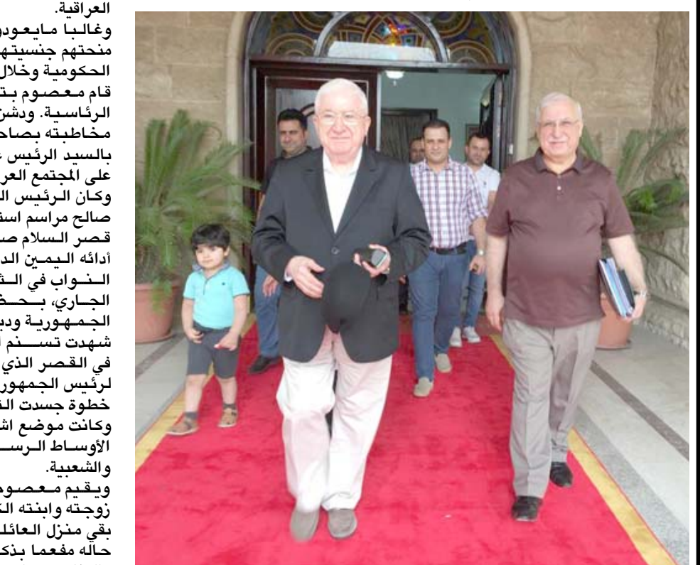
مغادرة: رئيس الجمهورية السابق فؤاد معصوم مغادراً قصر السلام في الجارية

بغداد - الزمان يدور سؤال في الشارع العراقي واوساط من النخب مؤاده، اين هو الان رئيس الجمهورية السابق فؤاد معصوم؟ فقد تابع الزاى العام عطية المتسلم والنسليم التي جرت بينه وبين الرئيس الحالي برهم صالح وتناقلت وسائل الاعلام مراسم هذه العملية الدستورية غير المسبوقة في التاريخ العراقي. وكانت جريدة الوقائع العراقية، وهي الجريدة الرسمية للدولة قد نشرت مرسوم تعيين صالح وحالة معصوم ونوابه الخالفة نوري المالكي وايباد