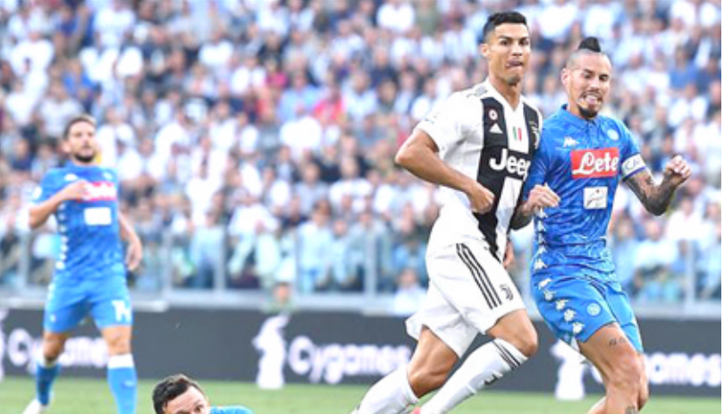
جانب من إحدى مباريات الدوري الإيطالي

قوية من لويس سواريز، مهاجم البارسا، من خلال ركلة حرة في الدقيقة السابعة. محاولات اتلتيكو بيلباو، بدأت طريق المهاجم بيليامز في الدقيقة 12، والتي مرت بتسديدة بجانب القائم الأيسر لأصحاب الأرض، وواصل بيلباو، محاولاته على مرمي برشلونة، بتسديدة من ساؤلوش في الدقيقة 25، بعد تمريرة سحرية من التشيلي أرتورو للضيوف، في الدقيقة 41، بعد كرة عرضية من زميله ماركيل سوساينا، أسس بها الحارس سيميون، ومع انطلاق الشوط الثاني، تعرض سيرجي روبرتو للإصابة، وفر الحرب أرتسو للفريدي، استبداله في الدقيقة 50، ودفع سيرجيو بوسكيتس، وبدلاً من برشلونة، سعيه نحو تسجيل هدف التعادل، بتسديدة عبر عثمان ييمبي وإيغان راكيتيتش وفيلبان كوتيتيو.