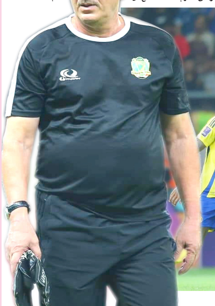
تعادل: فريق الشرطة يتعادل مع فريق النصر السعودي في ملعب الحبيبية

بغداد- الزمان بحد الاخطاء والاستعداد لمباراة الهلال القادمة وفي كل الاحوال فالمنارة والنتيجة لم تخلو من الفوائد للفريق الذي سيدخل منافسات دوري نجوم العراق بعد ايام في مهمة الدفاع عن لقب الكاس والدوري والشيء الواضح في الشرطة الاحتفاظ باللقب عاصمة التي حققت له لقب الموسم الماضي كما ظهر بشكل مقبول امام اول مهمة رسمية غير سهلة بسبب تأخر بدء الدوري فيما جاء النصر ولعب ثلاث مباريات بدوري روشن لكن الشرطة قدم نفسة في مهمة صعبة.