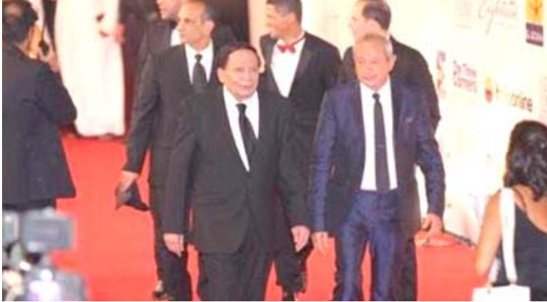
عادل أمام في حفل افتتاح مهرجان الجونة