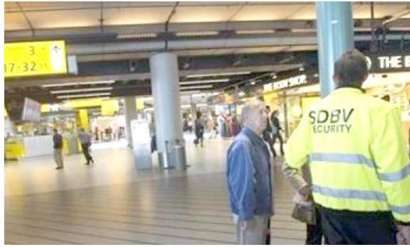
بغداد - الزمان

توقع منبئ جوي، حدوث مفاجآت جوية بشبهها العراق الأيام المقبلة، فيما تسببت عاصفة خريفية في بحر الشمال في تعطيل الحركة الجوية في مطار سخيبول في أمستردام، ثالث أكبر مطار في أوروبا. وقال منبئ صادق عطية من هيئة الأنواء الجوية والرصد الزلزالي في وزارة النقل على صفحته في الفيسبوك امس ان (حالة الاضطراب الجوي مستمرة في تأثيرها على عموم مدن البلاد ويبدو ان سيؤثر على الطيران التي اضطرت عمدا في الجانب الإيراني لهور العظیم وذلك بجهود فرق الاغاثة والاطفاء والبيئة التي توجهت الى الفور الى المنطقة، وأشار ضالعين في اشغال الحرائق عمدا في الهور).