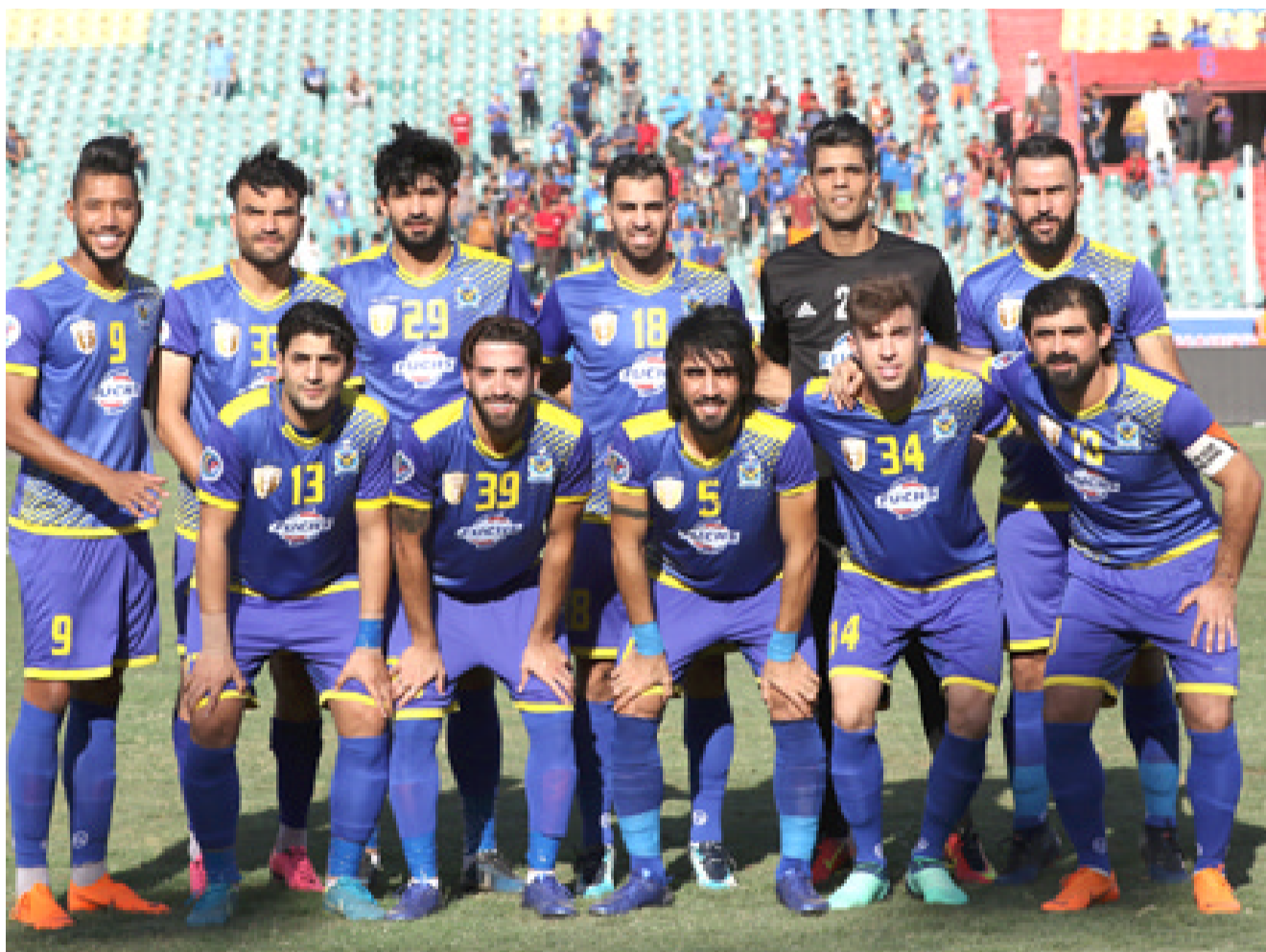
استعداداً : يستعد فريق القوة الجوية بالحفاظ على اللقب الآسيوي القادم

يكون قد اعد الفريق بحال أفضل من أي وقت مضى لأنه سيكون اسام ومناقصات مختلفة ولأن مواهبها تختلف تمام عن مشاركات بطولة الاتحاد الآسيوي ويأمل ان يقدم الفريق نفسه من خلال عكس الأداء المميز الذي اعتاد عليه كالفريق الذي يتنزه انصهاره في ان يتحج في تحقيق النتيجة المطلوبة بتحضيراً للمهمة الأولى والأصعب حيث مواجهة البداية الناجحة التي تليق بالزوراء في ان يظهر الاهتمام للدفاع عن لقبه ويعلم انصاره انه كلما اتت البداية ناجحة كلما انعكس ذلك على قادم المواجهات وهو يتوعد الشرطة في قسمة الجولة الثمانية والعودة للضراع الحقيقي لان الظاهر المحلي المتأخر سينعكس على المشاركة الأولى بطولة دوري الانباط الآسيوي المهمة الصعبة امام خبرات الفرق المشاركة وكل الانتظار تتجه نحو المدرب الذي يقضي الموسم الثاني مع الفريق الذي