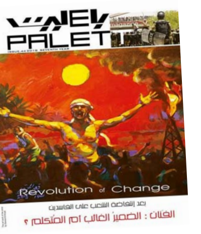
بغداد - رفاه العموري صدر في بغداد العدد من مجلة باليت 44 المتشكيلية الخاص بصيف 2018 والذي كان حافلا بغليان شعبي واسع في وسط وجنوب العراق بسبب حالة الترددي المؤسف بتقديم الخدمات وتفشي البطالة وتفكك البنى التحتية وسوء

استخدام موارد الدولة لتفشي الفساد الاداري والحكومي ، ولان الفن هو رسالة وقضية انسانية كان لجلة باليت موقع واضح وصريح في الاصطاف مع حقوق الشعب للاستمتاع بخبراته والتوزيع العادل للثروات دون أن تسبب بها فقة او حزب او طائفة او قومية معينة .. وهذا كان المحور الرئيسي للعدد ابتداء من الغلاف الاول الذي حمل لوحة عن انتفاضة