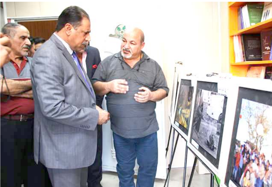
جانب من فعاليات معرض الطفولة