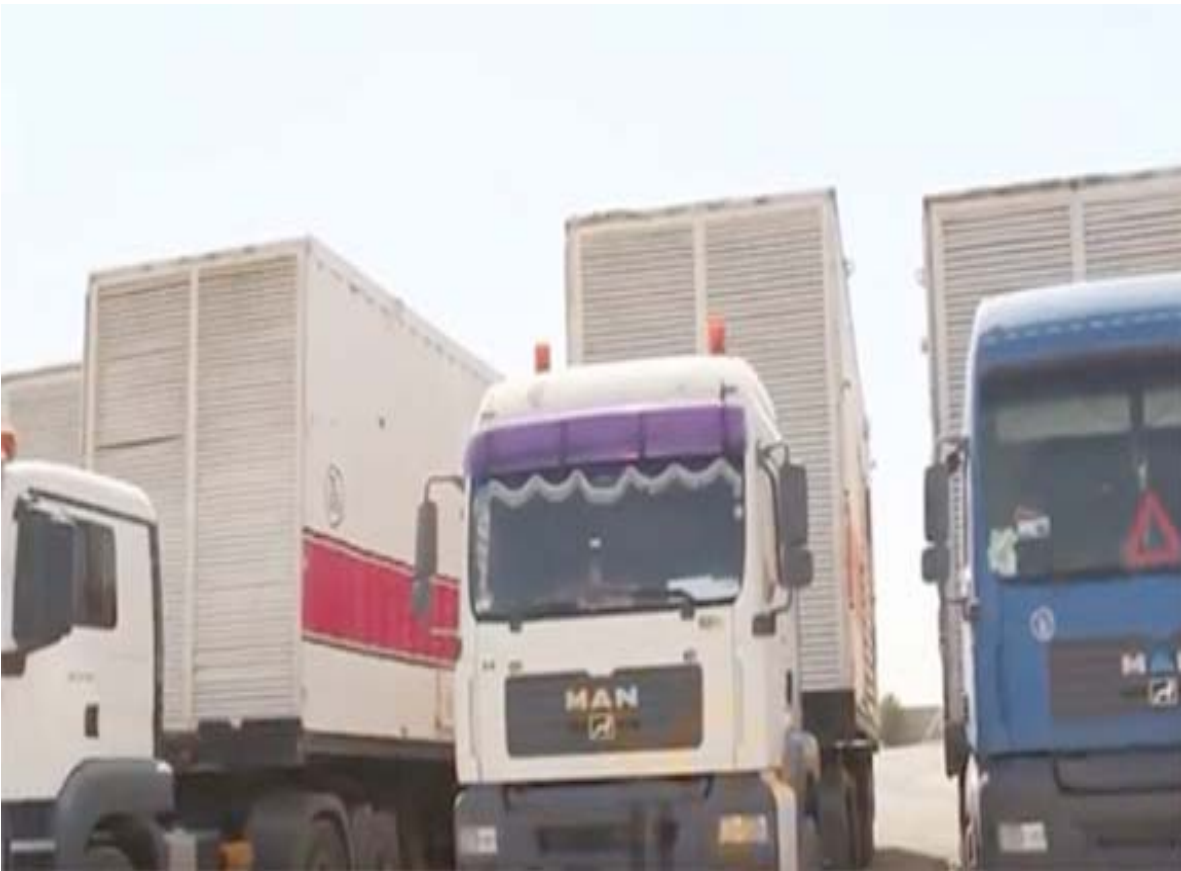
كهرباء ؛ شاحنات محمل مولدات كهرباء، عملاقة قادمة من الكويت