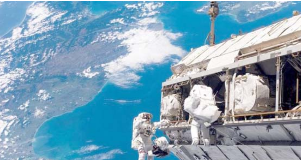
فضاء؛ لا تسمح الولايات المتحدة بأن يكون رواد الفضاء الصينيون من بين الرواد

ومن غير المرجح أن تبدأ الإدارة الوطنية للملاحة الجوية والفضاء في الولايات المتحدة "ناسا" التعاون بشكل صريح وواضح مع برنامج الفضاء الصيني في أي وقت قريب، وهو ما يعود جزئياً إلى السياسات التي تنتهجها الإدارة الأمريكية الحالية على الصعيد الدبلوماسي. لكن الأمر قد يختلف على المدى البعيد، فمع تفكير كلاً البلدين ملياً في العودة إلى القمر، وإرسال رحلات مأهولة إلى المريخ في نهاية المطاف؛ فمة سؤال مطروح يتعلق بما إذا كانت هاتان القوتان العظيمتان في مجال الفضاء ستبقيان متنافستين، أم ستحتاجان إلى "النهاية للعمل معاً". ويقول "ماتياس مورر": "سنحتاج إلى كل الشركاء الذين يمكن لنا العثور عليهم على ظهر هذا الكوكب، بمجرد أن ننظر إلى ما بعد المدار المحيط بالأرض، أي صوب القمر أو المريخ، وذلك لأن الأمر في هذا الحالة يصبح أكثر صعوبة وتكلفة، ونحتاج إلى أفضل التقنيات. إننا نهدف إلى إمداج الصينيين في الأسرة، وأن تكون لدينا) محطة أبحاث مستقلة جديدة على القمر. كلما كانت أورتنا أكبر حجماً، أصبحنا في وضع أفضل".