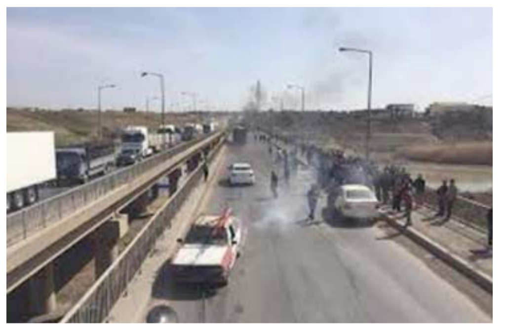
اختناق: طريق بغداد كركوك وقد شهد اختناقاً مرورياً

متظاهرون قرب القضاء الخالص احتجاجا على انقطاع الكهرباء عن القضاء ومناطق المحافظة لساعات طويلة) وأضاف ان (فتح الطريق جاء بعد تلقي المتظاهرين وعوداً بتحسين التيار الكهربائي في القضاء والمحافظة عموماً) وكان قائممقام قضاء عدي الخردان قد