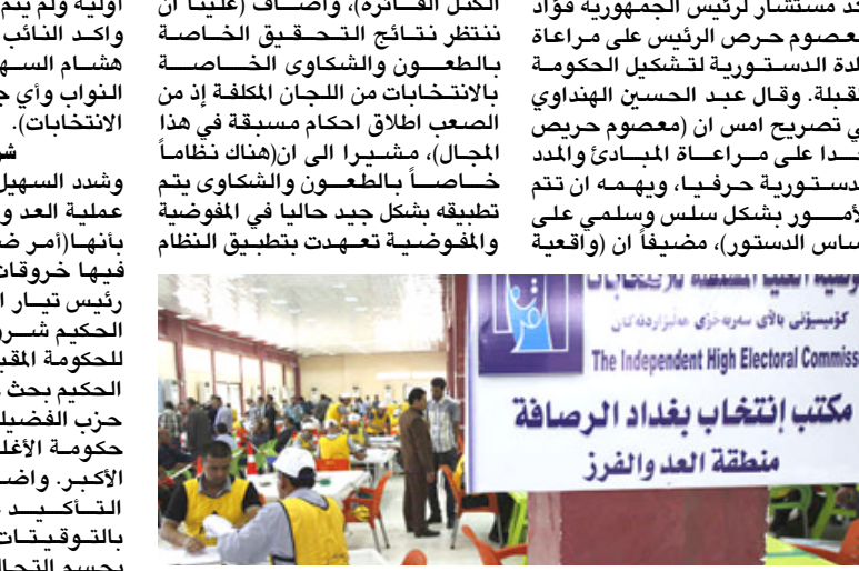
نتائج : منتسبو المفوضية يؤدون عملهم في فرز وعد الاصوات

بغداد - الزمان أكد مستشار الرئيس الجمهورية فؤاد معصوم حرص الرئيس على مراعاة المدة الدستورية لتشكيل الحكومة المقبلة، وقال عبد الحسين الهنذلي في تصريح امس ان معصوم حريص جدا على مراعاة المبادئ والمدة الدستورية حريفا، ويهجم ان تتم الاسور بشكل سلس وسلمي على اساس الدستور، مضيفا ان واقعية