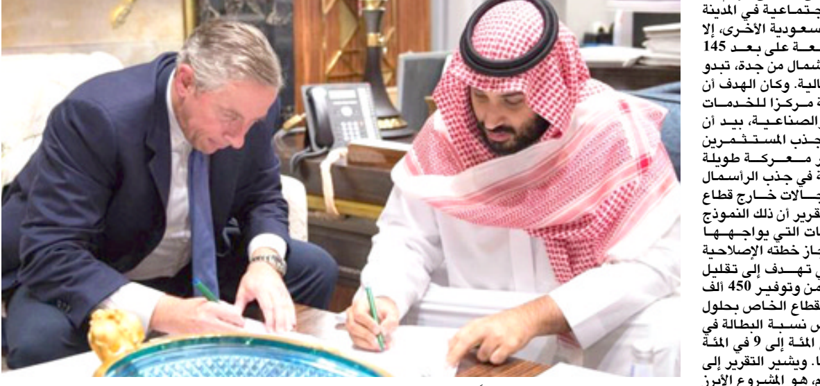
توقيع : محمد بن سلمان يوقع عدداً مع اقتصادي بريطاني

أخرى في منتجج القدية الترفيهي الذي تبلغ تكلفته مليارات الدولارات ويهدد حجمه مرتين ونصف عن بندي وورلد، بحسب وكالة رويترز للانباء. تمتد المنطقة الجديدة التي تعرف باسم بنوم على مساحة 26 ألفا و 500 كيلومتر مربع بالاشتراك مع مصر والأردن وقال بيان اصوره الصندوق السعودي ان وزارة التجارة والاستثمار سحلت شركة البحر الأحمر كشرية مساهمة مغلقة تعود ملكيتها كليا لصندوق الاستثمارات الأجنبية، وأضاف البيان ان جون باجاسون، المدير التنفيذي السابق لتطوير مجموعة كناري وارف في لندن، قد عين رئيسا تنفيذيا للشركة. ووضح البيان ان الشركة ستطور منطقة اقتصادية خاصة تتمتع بإطار تنظيمي مستقل، تضمن توفير عدة تسهيلات، كمنح تأشيرات الدخول عند الوصول وتخفيف القيود الإجتماعية، فضلا عن توفير أنظمة تجارية مستورة. وأشار البيان إلى ان ذلك سيتمكن الشركة من التطور والتقدم وصولا إلى إنشاء مقصد سياحي عالمي. ويعتقد ان صندوق الثروة السادية الذي يراسه بن سلمان يملك أصولا بقيمة 183 مليار دولار، ومن المنتظر زيادة تلك الأصول بعد بيع حصة من شركة النفط السعودية العملاقة أرامكو، إذ تعهدت المملكة بصناعة حجم الصندوق ليصل إلى 400 مليار دولار بحلول عام 2020.