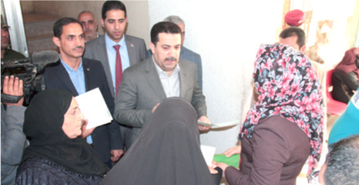
بغداد - الزمان وجه وزير العمل والشؤون الإجتماعية محمد شياع السوداني بتسهيل الاجراءات للمواطنين وخصوصا في ما يتعلق بانجاز معاملات القروض وتحديث بيانات الاستشارية.

وقال بيان للوزارة تلقته (الزمان) امس ان هذا التوجيه جاء (إخلاق تفقد السوداني دائرة التشغيل والقروض يوم امس واطلاعه على الية انجاز معاملات المواطنين بدءا من الاستعلامات الالكترونية وتوزيع معاملات القروض للمتقدمين الذين ظهرت اسماؤهم في الدفاتر الاخيرة 23 و 24، والى التأكيد على اعطاء مهلة ثلاثة اشهر للمتقدم لغرض المراجعة لتوزيع معاملات القروض وبخلافه يسقط حقه بعد انقضاء المدة). وأكد السوداني (اهمية متابعة مشاريع القروض ودراسة الجدوى الاقتصادية لها وبيان مدى نجاح تلك المشاريع في ان تكون مصدرا مدبرا للنخل لصالحها) كما اطلع على (اليه تحديث بيانات الاستشارية للمتقدمين عن العمل المسجلين في قواعد بيانات الدائرة، ووجه بصضرورة ايجاد اليه مبسطة وطريقة اسهل بخصوص تحديث بيانات الاستشارية وذلك من خلال تحديث المستفيد بالبيانات في أقرب مركز او في منزله من دون مراجعة المواطن للدائرة وهو نوع من الخدمات التي تقدمها الوزارة للمواطن).