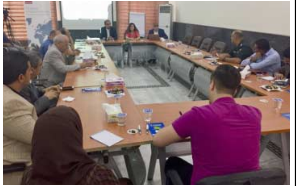
مرصد: جانب من ندوة تشكيل مرصد يحد من الكراهية

بغداد - رحيم الضوي - رجاه حميد رشيد توصلت جلسة حوارية نعت اليها منظمة دعم الاعلام الدولي ، الى تشكيل فريق مشترك من المؤسسات الاعلامية وصحفيين ووزارة الداخلية واتفاق اثناء مرصد للحد من خطاب الكراهية والعنف وترسيخ السلم الاهلي .