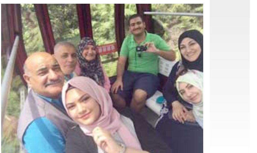
زيارة (الزمان) مع عوائل عراقية تزور ماليزيا

كان برنامجنا في هذا اليوم الاول من الرحلة حافلا ومتنوعا ومزجحا ومثيرا فاننا سوف نحلق دائما عاليا لاكتشاف عظمة ماليزيا في البناء والعمار لاطول برجي التوام اللذين يقعان في وسط العاصمة الماليزية وبطن علبهما (بيتروناس) او (KLCC) وبعد هذا البرج منذ 1998 حتى 2004 هو اطول برج في العالم حيث يبلغ ارتفاعه 342 م وعدد الطوابق 88 طابقاً . قامت ببناء البرج شركة كبريانا بصمم ليكون مرنا لمواجهة الرياح وفيه 76 مصعداً كبريانيا يعمل 26 راكباً هذه المرة الثانية التي اזור فيها ماليزيا ولم افتر بالصعود الى البرجين لصعوبة ذلك : ان على النفوس فجزا الانذاب الى حيث الطابور الطويل للوقوف حتى يتم توزيع بطاقة صعود البرج وهذا لم يتفقد او مع الكرويانا لكن من يتسابق الى مع الكرويانا لكن الصون ونحن تحت البرجين وفي حديقة الرائحة الجمال التي تحضن البرج التوام من الاسفل. ففي هذه الحديقة تجد (الخضرة والهواو النقي الوجهة الحسن) وفيها 900 شجرة و74 نخلة ومجموعة من المسطحات المائية، وفيها النافورة الملونة الراقصة العجيبة التضميع ليل.