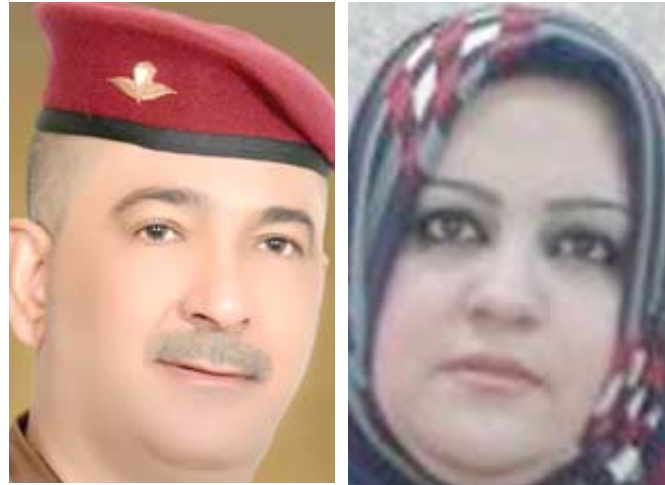
غالب العلية / ايتبال الدابي

انه (تم توقيع عقدين مع المديرية العامة لتوزيع كهرباء الرصافة لتجهيزها بكمية 294 محولة توزيع بمختلف السعات) ، و اضاف عارف ، ان الشركة قامت بتجهيز الدفعة الاولى من هذين العقدين والبالغة 68 محولة وتتواصل تجهيز الدفعات الاخرى تتعاقد خلال الفترة المقبلة القادمة، و اوضح عارف، ان ( الشركة ) لتصلح محولة لفترة سعة 63 م .