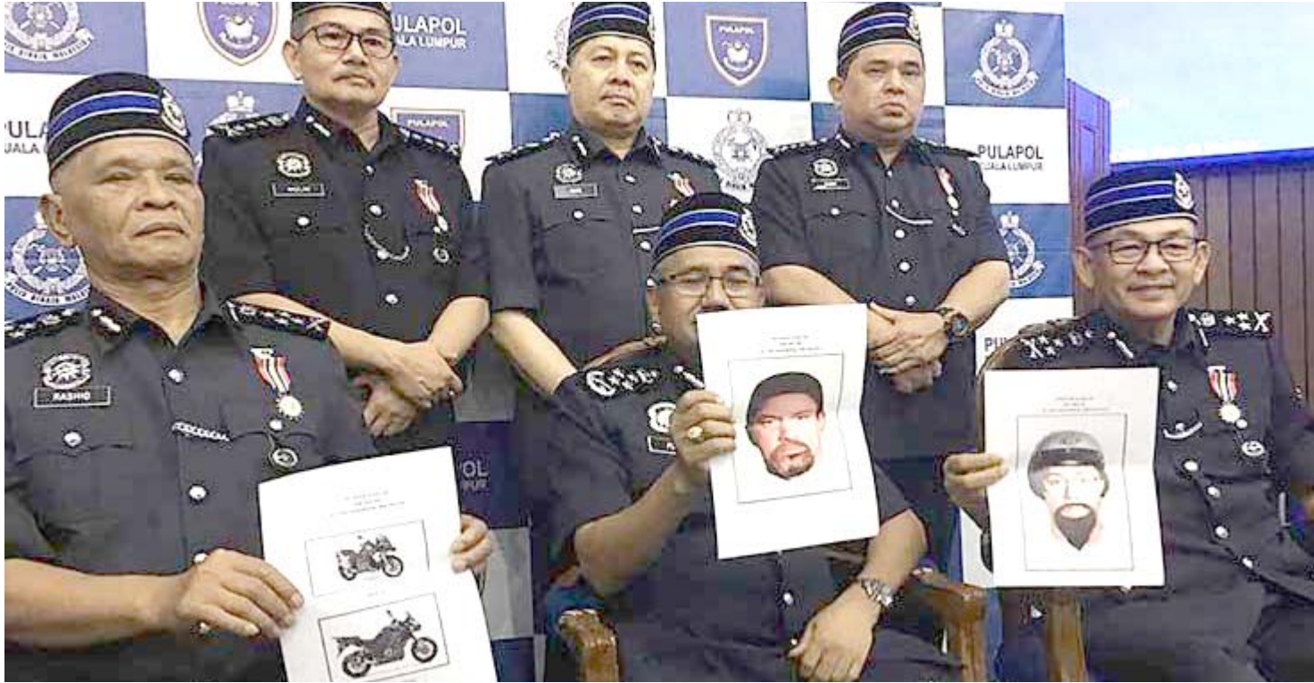
صور: الشرطة الماليزية تكشف عن صور المشتبه بهم في قتل فلسطيني فادي البطش