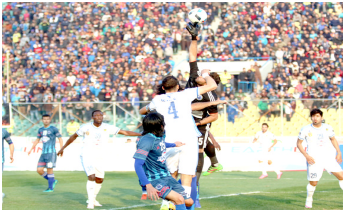
ديابعية، حقق فريق القوة الجوية فوزاً عريضاً برباعية على فريق الطلبة في الماتز