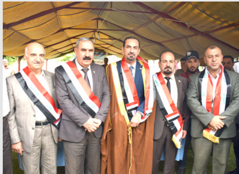
وفد الإتحاد العام للتعاون في نينوى