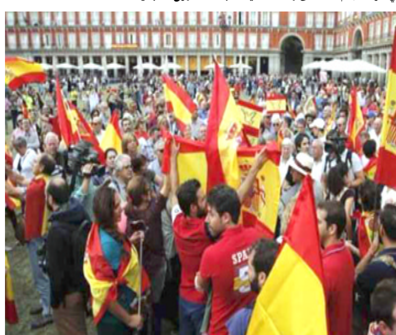
إحتجاج: متظاهرون في برشلونة محتجون على اعتقال انفصاليين

□ برشلونة - (أ ف ب): بعد ستة اشهر على اولى عمليات توقيف قادة للانفصاليين الكتالونيين، تضمنت تظاهرة اسس الاصدى في برشلونة للاحتجاج على استمرار اعتقال تسعة انفصاليين متممين بالتمسرد والمطالبة بفتح حوار سياسي. اطلقت الدعوة الى التظاهر اعتباراً من الساعة 30.12 30.10 (غ) مجموعة انشئت في مارس في منطقة شمال شرق اسبانيا للدفاع عن المؤسسات الكاتالونية وعن الحقوق والحريات الأساسية للمواطنين. اثار مشاركة ناقياتين كيدرتين وجمعيتين انفصاليين جدلاً واحتجاجات من قبل الذين لم يرغبوا يوماً في الاستقلال فيها. وقال الأمين العام للقنصلية العامة للعمل في كاتالونيا كاميل روس ردا على سؤال لوكالة فرانس برس حدث توتر (بين الانفصاليين) كما في كل المجتمع الكاتالوني.