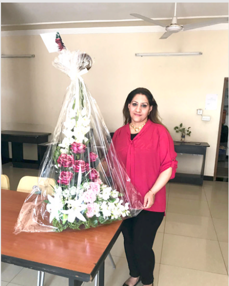
باقه ورد إلى (الزمان)