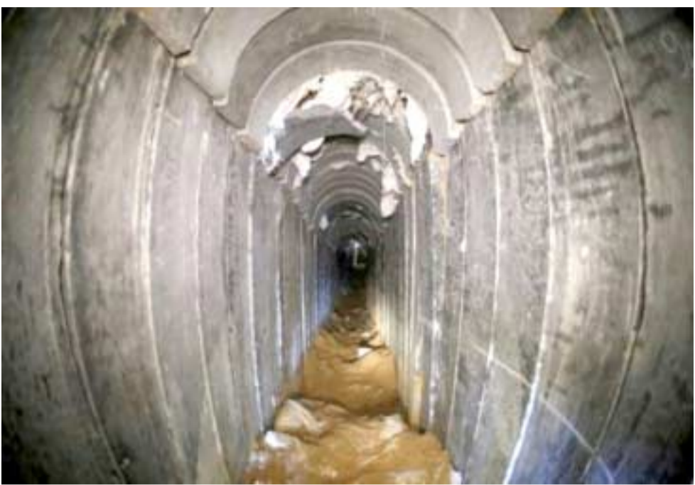
نفق، صورة لنفق على الحدود بين اسرائيل وغزة

تل أبيب تعلن مواصلة التحرك ضد ايران في سوريا