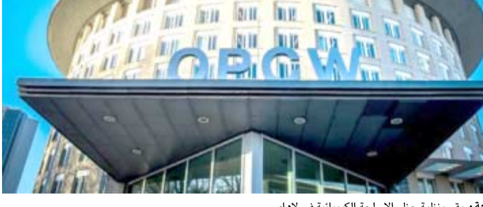
اسلحة، مقر منظمة حظر الاسلحة الكيميائية في لامي

لعمل هذه البعثة. وقال 'سندها نقوم بعملها بشكل مهني وموضوعي وحيداني ومن دون اي ضغط'. وأضاف 'ان ما سنحصر عنها سيكتب الاعاءات بحق بلادنا. البعثتين