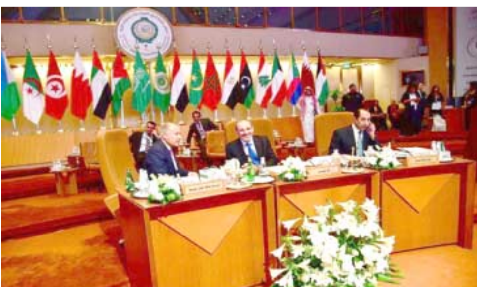
قمة العربية في الرياض

الظهران (السعودية)، (ا ف ب) - غداة الضربات الغربية على سوريا، استضافت السعودية اليوم الأحد القمة السنوية لجامعة الدول العربية التي يُعقد في تناقض إضافة إلى الوضع السوري ملفات إيران واليمن ومستقبل القدس. والدورية للجامعة التي تضم 22 عضواً، ويقول خبراء انها ستعقد باتجاه موقف قوي وموحد تجاه إيران، منافستها الرئيسية في الشرق الأوسط. ودخلت الرياض وطهران في صراعات بالوكالة منذ سنوات عدة، من سوريا واليمن في العراق وليبان. وتعتقد القمة العربية بعد ساعات من ضربات وجهتها الولايات المتحدة وبريطانيا وفرنسا لنظام الرئيس السوري بشار الأسد المتحالف مع إيران وروسيا ردا على هجوم كيميائي مفترض في مدينة دوما.