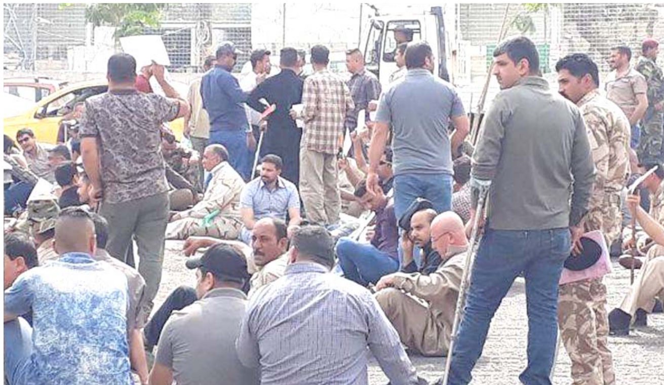
تظاهرة : جرعى الجيش خلال تظاهرة للمطالبة بعدم نقلهم