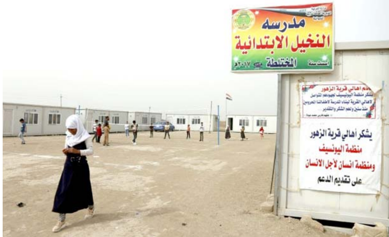
مدرسة: اطفال يسيرون امام مدرسة ابتدائية في قرية الزهور جنوب بغداد

مهمة الغجر وبعض الأعمال التي جرح كثيرون، ما دفع بعدد كبير من العائلات للنزوح إلى مناطق أخرى في البلاد. أما اليوم، استطاعت مئات العائلات التي بقيت في القرية، ويفضل حملة لجمع التبرعات، من إعادة افتتاح مدرسة في وسط القرية على امتداد طريق تربية تتكدس على جانبيها أكوام النفايات حيث تتجمع بعض طيور الإوز.